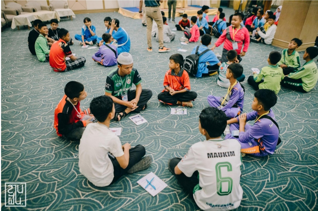
แผนภาพที่ ๔-๗ การเปิดเวทีพูดคุยทำความเข้าใจกับทีมเยาวชนในพื้นที่