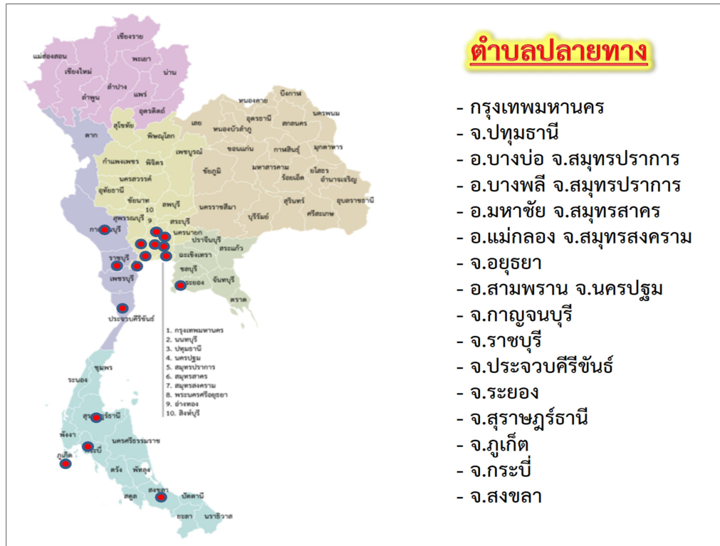
แผนภาพที่ 2 – 1 แสดงตำแหน่งของพื้นที่ตอนใน หรือตำบลปลายทาง

กองกำลังสุรสีห์มีการจัดหน่วยเฉพาะกิจป้องกันชายแดน ซึ่งใช้คำย่อว่า “ฉก.” จำนวน 3 หน่วย ได้แก่ ฉก.ลาดหญ้า (จัดกำลังจากกรมทหารราบที่ 9) รับผิดชอบพื้นที่จังหวัดกาญจนบุรี ฉก.ทัพพระยาเสือ (จัดกำลังจากกรมทหารราบที่ 19) รับผิดชอบพื้นที่จังหวัดราชบุรี และจังหวัดเพชรบุรี และ ฉก.จงอางศึก (จัดกำลังจากกรมทหารราบที่ 29) รับผิดชอบพื้นที่จังหวัดประจวบคีรีขันธ์ ในการกำหนดแนวทางการสกัดกั้นการกระทำผิดกฎหมายของกองกำลังสุรสีห์ได้ประสานการปฏิบัติกับส่วนบังคับบัญชาและส่วนราชการที่เกี่ยวข้อง และแบ่งพื้นที่ปฏิบัติงานให้เกิดการประสานสอดคล้อง โดยแบ่งออกเป็นพื้นที่เฝ้าระวังภายนอกประเทศ (พื้นที่เฝ้าสังเกตอาการฝั่งเมียนมา จำนวน 14 แห่ง) และพื้นที่ภายในประเทศ ซึ่งประกอบด้วย พื้นที่แนวชายแดน (ต้นน้ำ) พื้นที่ถัดจากแนวชายแดน (กลางน้ำ) และพื้นที่ตอนใน (ปลายน้ำ หรือเรียกว่า “ตำบลปลายทาง”) ซึ่งการปฏิบัติที่สำคัญจะมีความแตกต่างกันไปในแต่ละพื้นที่ (กองกำลังสุรสีห์, 2566)