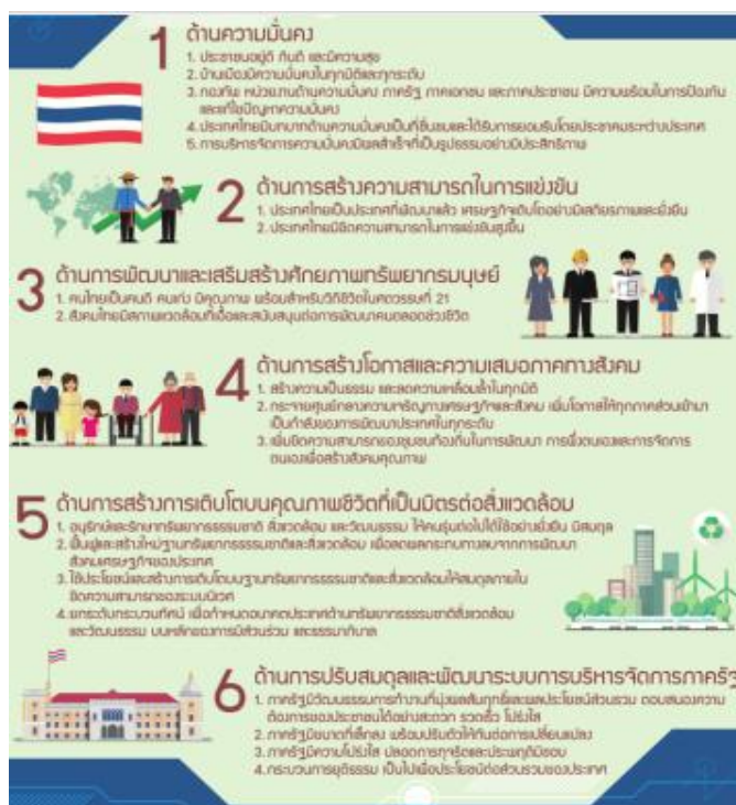
แผนภาพที่ 2 - 2 ภาพแสดงเป้าหมายในการพัฒนาประเทศ 6 หลักยุทธศาสตร์

โดยมีเป้าหมายการพัฒนาที่สำคัญเพื่อปรับเปลี่ยนภาครัฐที่ยึดหลัก “ภาครัฐประชาชน เพื่อประชาชนและประโยชน์ส่วนรวม” โดยภาครัฐต้องมีขนาดที่เหมาะสมกับบทบาทหน้าที่ ภารกิจ แยกแยะบทบาทหน่วยงานของรัฐที่ทำหน้าที่ในการกำกับหรือในการให้บริการยึดหลักธรรมาภิบาล โดยปรับวัฒนธรรมการทำงานให้มุ่งผลสัมฤทธิ์และผลประโยชน์ส่วนรวม มีความทันสมัย และพร้อมที่จะปรับตัวให้ทันต่อการเปลี่ยนแปลงของโลกอยู่ตลอดเวลา โดยเฉพาะอย่างยิ่งการนำนวัตกรรม เทคโนโลยีที่มีข้อมูลขนาดใหญ่ ระบบการทำงานที่เป็นดิจิทัลเข้ามาประยุกต์ใช้อย่างคุ้มค่า และปฏิบัติงานเทียบได้กับมาตรฐานสากล รวมทั้งมีลักษณะเปิดกว้าง เชื่อมโยงถึงกัน และเปิดโอกาสให้ทุกภาคส่วนเข้ามามีส่วนร่วมเพื่อตอบสนองในความต้องการของประชาชนได้อย่างสะดวก รวดเร็ว และโปร่งใส ทุกภาคส่วนในสังคมต้องร่วมกันปลูกฝังค่านิยมของความซื่อสัตย์สุจริต ความมั่งคั่ง และสร้างจิตสำนึกในการปฏิเสธ ไม่ยอมรับการทุจริตประพฤติมิชอบ นอกจากนี้ กฎหมายต้องมีความชัดเจน มีเพียงเท่าที่จำเป็น มีความทันสมัย มีความเป็นสากล มีประสิทธิภาพ และนำไปสู่การลดความเหลื่อมล้ำและเอื้อต่อการพัฒนา โดยกระบวนการยุติธรรมมีการบริหารที่มีประสิทธิภาพ ปี น ธิ ร ร ม ไม่เลือกปฏิบัติเข้าข้างฝ่ายใดฝ่ายหนึ่ง และการอำนวยความสะดวกตามหลักนิติธรรม