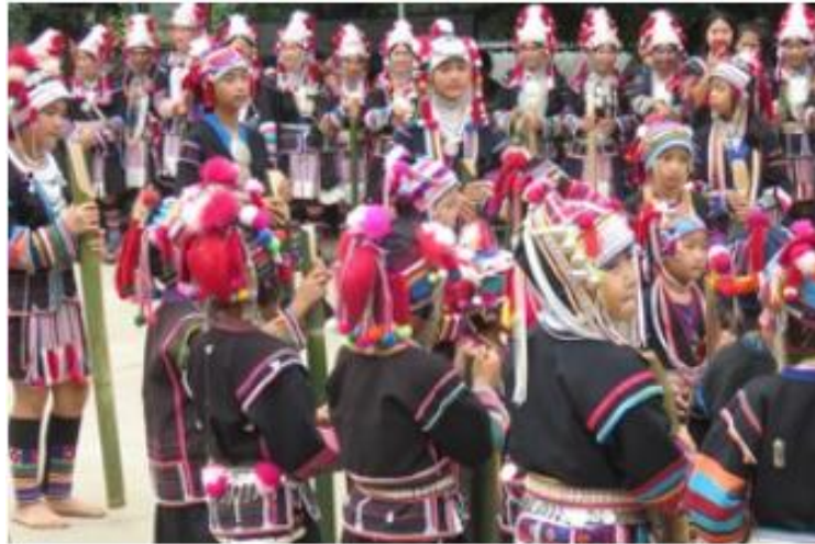
แผนภาพที่ 1 - 1 ภาพแสดงลานแคของ วัฒนธรรมของชุมชนชนเผ่าอาข่า