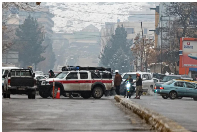
แผนภาพที่ 3-2 ภาพถ่ายกรณีกลุ่ม ISKP ก่อเหตุระเบิดฆ่าตัวตายที่กระทรวงการต่างประเทศ ในกรุงคาบูล อัฟกานิสถานเมื่อ 11 ม.ค.66

ในปี 2565 ทัวโลกยังคงหวงกังวลเกี่ยวกับสถานการณ์ในอัฟกานิสถานและผลกระทบต่อการก่อการร้าย เนื่องจากอัฟกานิสถานยังคงเสี่ยงเป็นศูนย์กลางและแหล่งบ่มเพาะกลุ่มก่อการร้ายของโลก แหล่งดึงดูดนักรบต่างชาติ (Foreign Terrorist Fighters: FTFs) เช่นเดียวกับที่เคยเกิดขึ้นในอิรักและซีเรีย โดยในปี 2565 กลุ่ม Islamic State in Khorasan Province (ISKP) ก่อเหตุโจมตีพื้นที่ทางการทหาร ศาสนาสถานของนิกายชีอะห์และซิกข์ และผลประโยชน์ของต่างชาติทั้งจีน ปากีสถาน และรัสเซียในอัฟกานิสถาน เพื่อบั่นทอนความน่าเชื่อถือของรัฐบาลตอลิบาน ขณะที่การสู้รบระหว่างรัสเซียกับยูเครนอาจทำให้ FTFs สมาชิก และผู้สนับสนุนกลุ่มก่อการร้าย เฉพาะอย่างยิ่งผู้มีแนวคิดรุนแรงขวาจัด ใช้อุเครนเป็นสถานที่ฝึกการสู้รบและสร้างเครือข่ายข้ามภูมิภาค ซึ่งทำให้อุเครนเสี่ยงเป็นศูนย์กลางการเคลื่อนไหวแห่งใหม่ของกลุ่มก่อการร้ายในอนาคต (Global Trend 2040, The National Intelligence Council online, 2021)