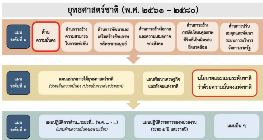
แผนภาพที่ ๒ - ๑ ความเชื่อมโยงของแผนระดับต่าง ๆ