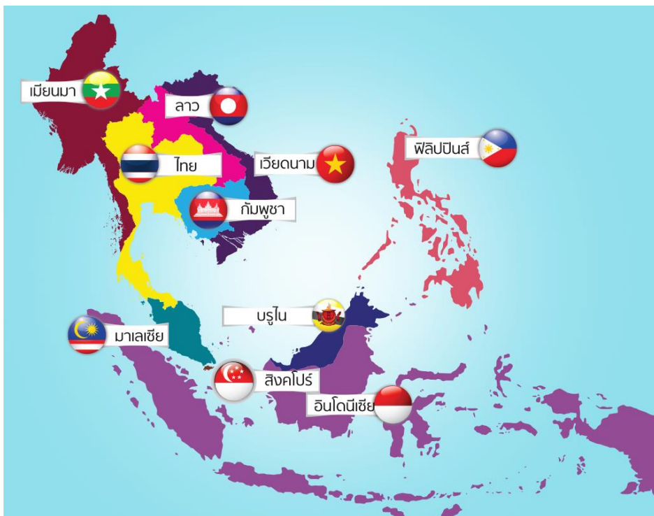
แผนภาพที่ 2-1 : แสดงที่ตั้งทางภูมิศาสตร์และธงประจำชาติอาเซียน