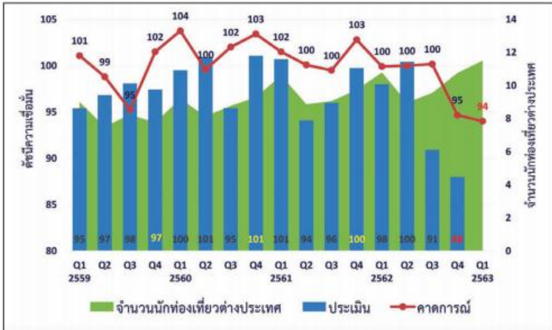
แผนภาพที่ 3 – 1 ดัชนีความเชื่อมั่นผู้ประกอบการธุรกิจท่องเที่ยวประเทศไทย ปี 2559 - 2562

ที่มา : ศูนย์ข้อมูลผู้ประกอบการอุตสาหกรรมการท่องเที่ยวแห่งประเทศไทย