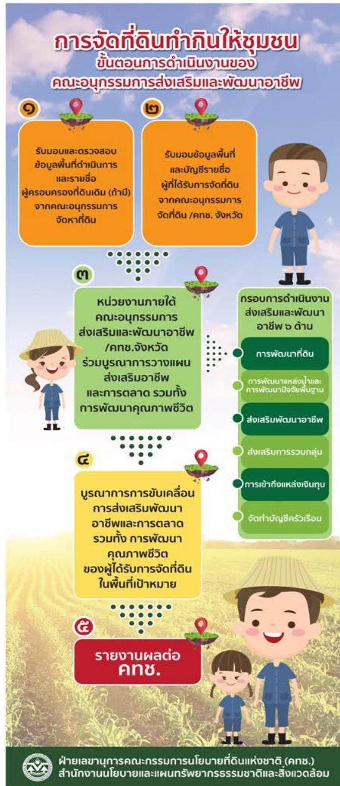
แผนภาพที่ 3-3 ขั้นตอนการดำเนินงานของคณะกรรมการส่งเสริมและพัฒนาอาชีพ