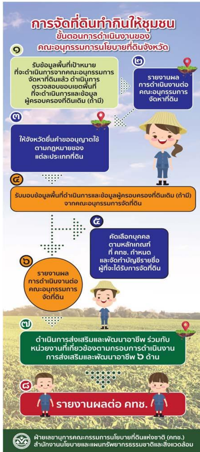
แผนภาพที่ 3-4 ขั้นตอนการดำเนินงานของคณะกรรมการนโยบายที่ดินจังหวัด (คทช.จังหวัด)