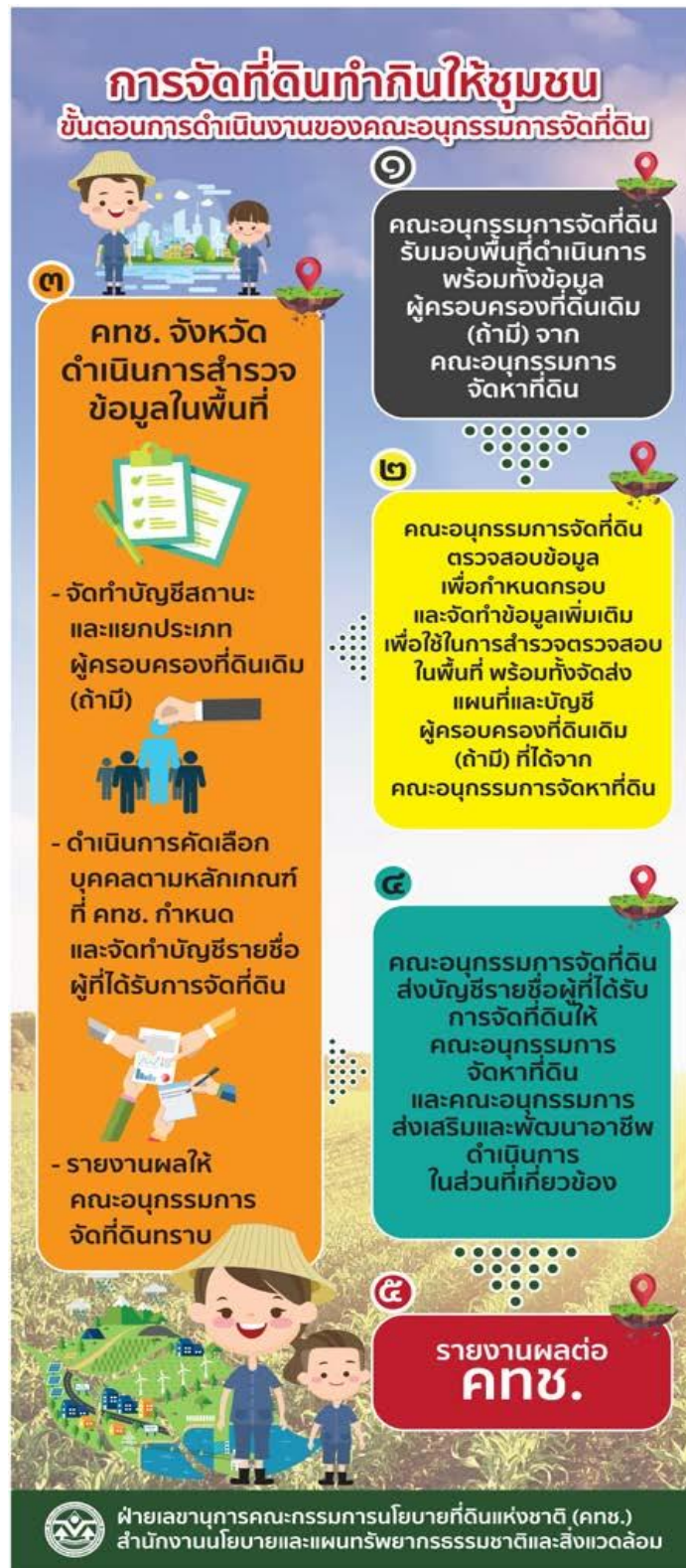
แผนภาพที่ 3-2 ขั้นตอนการดำเนินงานของคณะกรรมการจัดที่ดิน