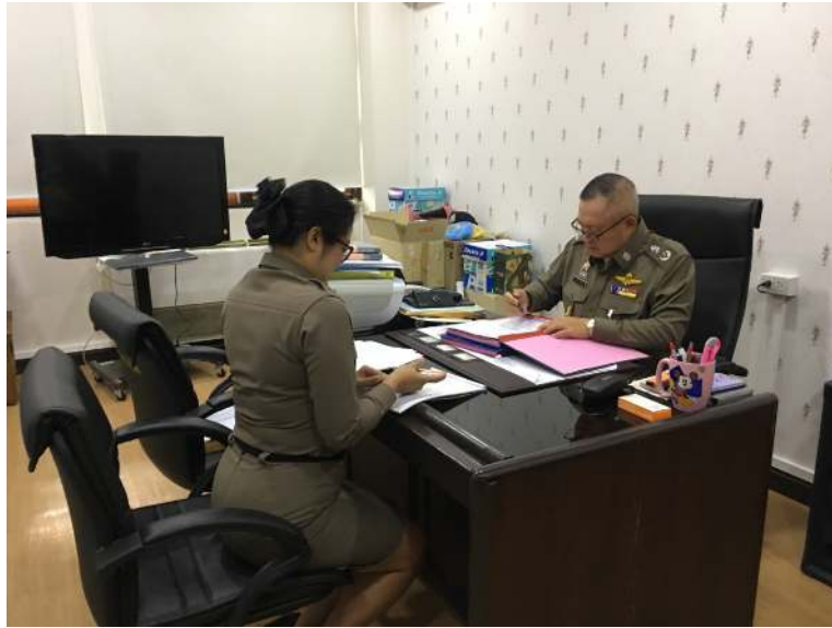
พล.ต.ต. วันชาติ คำเครื่อง รองผู้บัญชาตำรวจตระเวนชายแดน

ณ ห้องทำงาน รองผู้บัญชาตำรวจตระเวนชายแดน ชั้น 5 อาคารจตุลระพราหมณ์