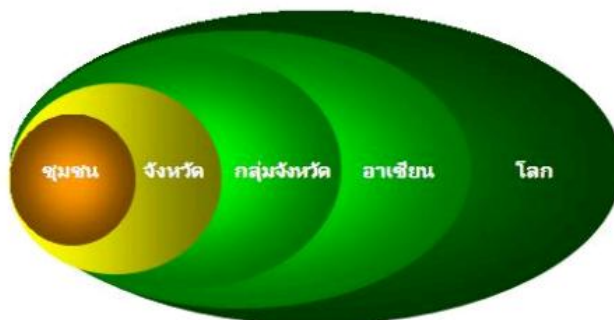
แผนภาพที่ 2 - 2 การเชื่อมโยงกับประชาคมโลก

ในการเชื่อมโยงกับโลกภายในมี 3 ระดับ คือ การเชื่อมโยงเศรษฐกิจภายในประเทศ (จากชุมชนสู่จังหวัดและกลุ่มจังหวัด) การเชื่อมโยงกับเศรษฐกิจภูมิภาค (อาเซียน) และการเชื่อมโยงกับเศรษฐกิจโลก