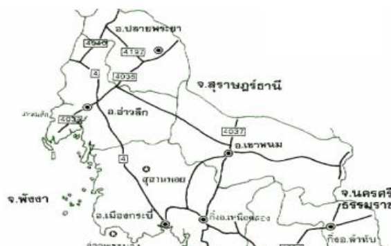
แผนภาพที่ 3 - 1 แผนที่จังหวัดกระบี่

ที่ตั้งและอาณาเขตจังหวัดกระบี่ มีทิศเหนือ ติดต่อกับ จ.พังงา และ จ.สุราษฎร์ธานี ทางด้าน อ.ปลายพระยา และ อ.เขาพนม ทิศใต้ ติดต่อกับ จ.ตรัง และ ทะเลอันดามัน ทางด้าน อ.เกาะลันตา อ.เมืองกระบี่ และ อ.เหนือคลอง ทิศตะวันออก ติดต่อกับ จ.นครศรีธรรมราช และ จ.ตรัง ทางด้าน อ.เขาพนม อ.คลองท่อม และ อ.ลำทับ ทิศตะวันตก ติดต่อกับ จ.พังงา และทะเลอันดามัน ทางด้าน อ.อ่าวลึก และ อ.เมืองกระบี่