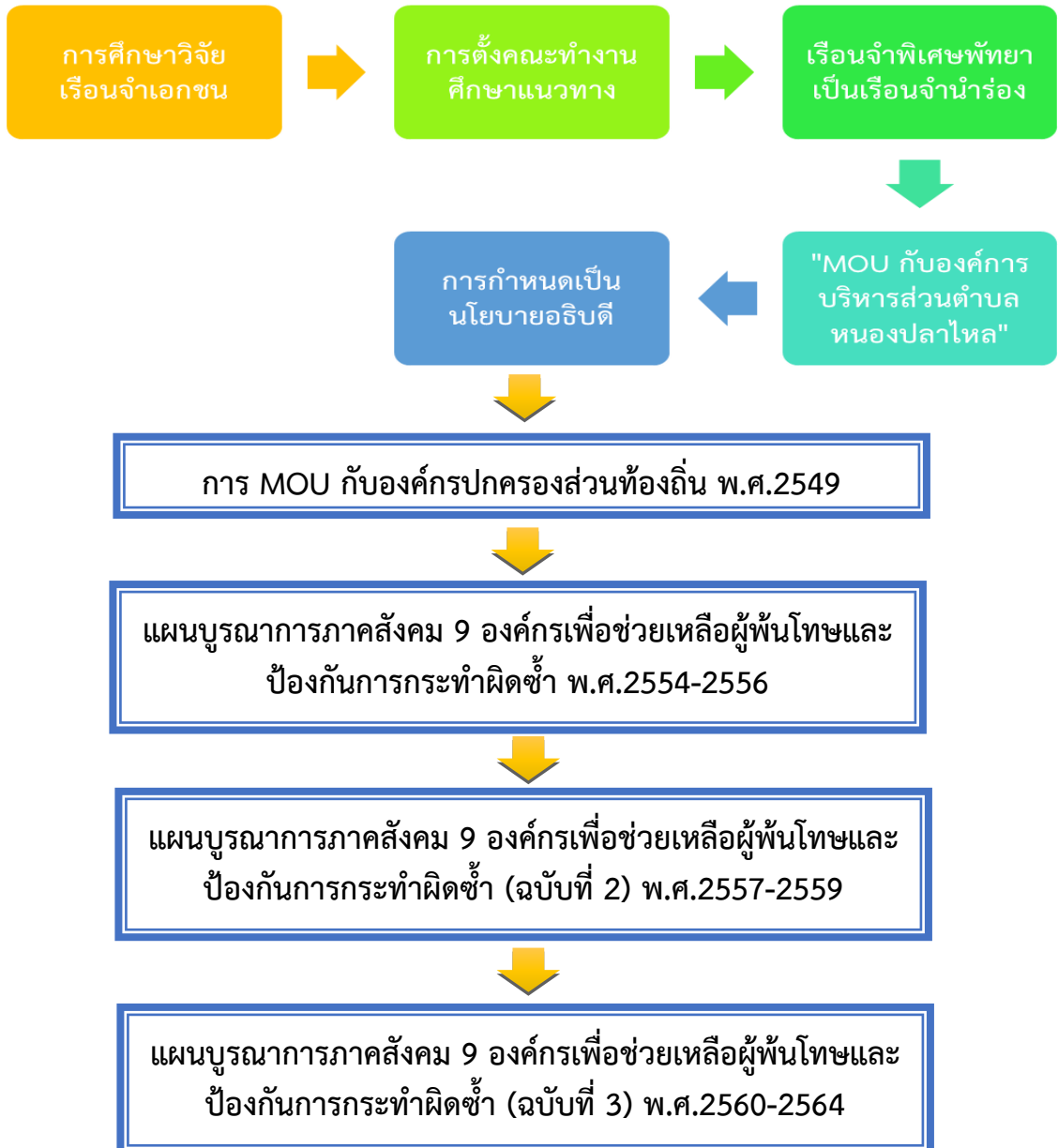
แผนภาพที่ 4-2 : ขั้นตอนของงานราชทัณฑ์ตำบลสู่การสร้างเครือข่ายความช่วยเหลือผู้พ้นโทษ