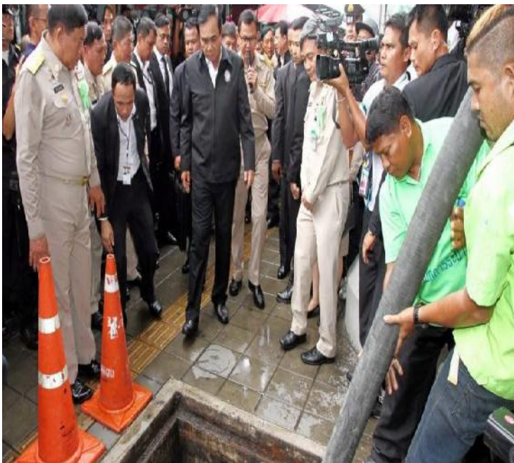
พล.อ.ประยุทธ์ จันทร์โอชา นายกรัฐมนตรีและหัวหน้าคณะรักษาความสงบแห่งชาติ (คสช.) ลงพื้นที่ตรวจเยี่ยมการปฏิบัติงานแก้ไขปัญหาน้ำท่วม ณ สถานีสูบน้ำพระโขนง โดยกล่าวว่า รัฐบาลพยายามแก้ปัญหาที่รากเหง้าปัญหาเรื่องน้ำ โดยขอให้ประชาชนต้องมีส่วนร่วม โดยเฉพาะการแก้ปัญหขยะที่อุดตันทางระบายน้ำจนส่งผลให้เกิดน้ำท่วมขังหลายพื้นที่ใน กทม. ข้อมูลจาก https://www.thairath.co.th/content/956497