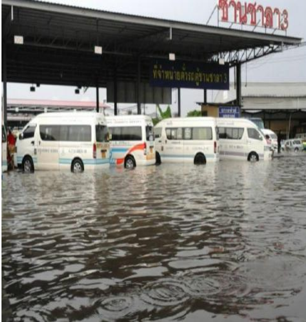
แผนภาพที่ ๓-๖ : ปัญหาขยะที่อุดตันทางระบายน้ำจนส่งผลให้เกิดน้ำท่วมขัง