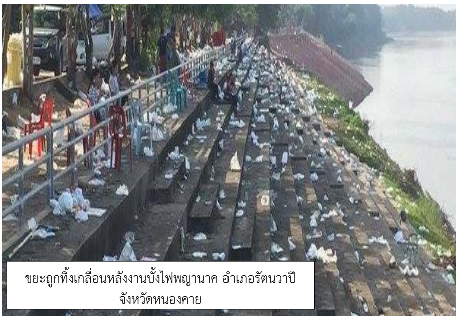
ที่มา : คนไทยไร้ระเบียบที่สุดในโลก จริงไหม?, ออนไลน์, ๒๕๖๐