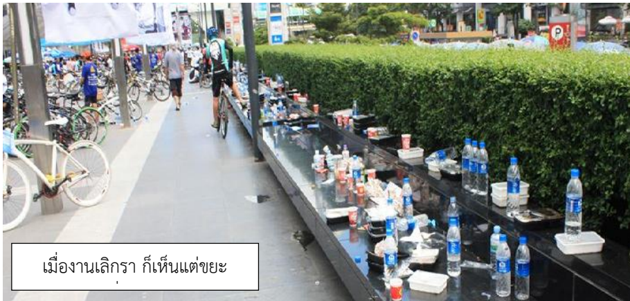
แผนภาพที่ ๓ - ๓ : ขยะที่ถูกทิ้งเกลื่อนในที่สาธารณะ