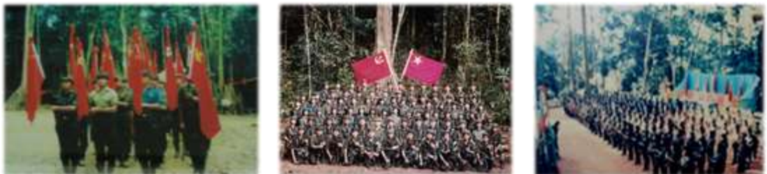
แผนภาพที่ ๒-๒ กองกำลังโจรคอมมิวนิสต์มลายา