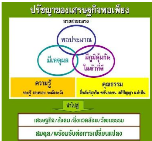
แผนภาพที่ ๒-๓ กรอบแนวคิดปรัชญาของเศรษฐกิจพอเพียง

จากการศึกษากรอบแนวคิดหลักปรัชญาเศรษฐกิจพอเพียง มีแนวทางมาจากหลัก ๓ ห่วง ๒ เงื่อนไข ประกอบด้วย ความพอประมาณ มีเหตุผล มีภูมิคุ้มกันในตัวที่ดี บนพื้นฐานเงื่อนไขความรู้ คุณธรรม ถือได้ว่าเป็นหลักสำคัญในวิถีการดำเนินชีวิตที่อยู่บนทางสายกลางทำให้เกิดความสมดุลและยั่งยืนเป็นองค์ประกอบสำคัญที่เชื่อมโยงในมิติด้านเศรษฐกิจ สังคม สิ่งแวดล้อม และวัฒนธรรม