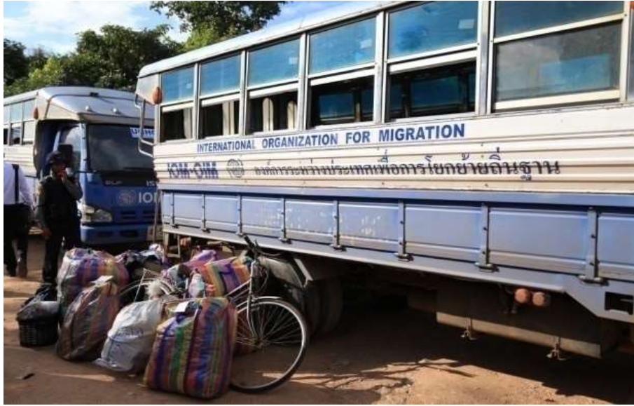
แผนภาพที่ ๑๓ ภาพการส่งผู้หนีภัยการสู้รบจากเมียนมา กลุ่มนาร์รอง กลับมาตุภูมิ