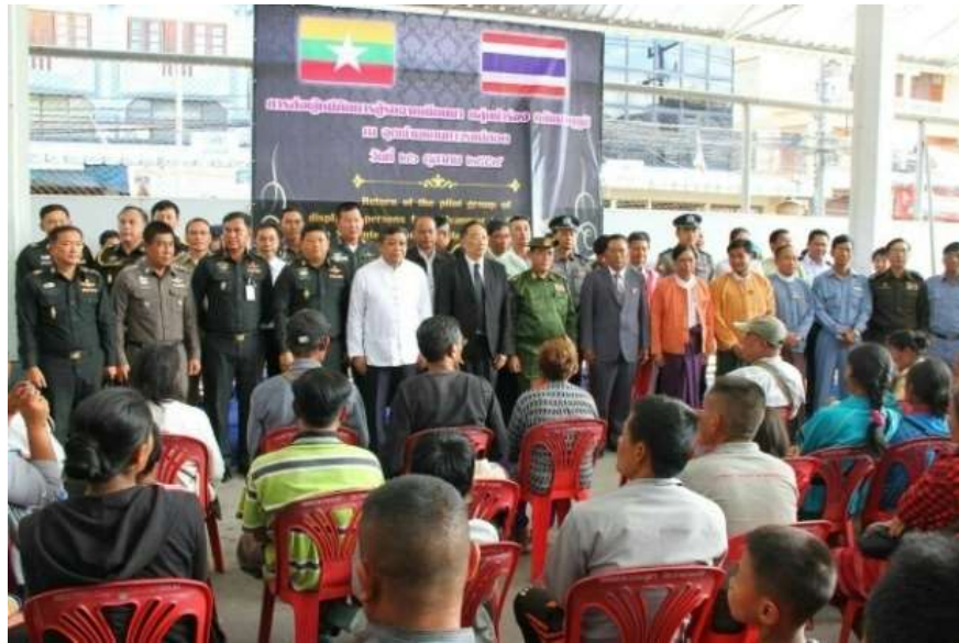
แผนภาพที่ ๑ ภาพการส่งผู้หนีภัยการสู้รบจากเมียนมา กลุ่มนาร์รอง กลับมาตุภูมิ