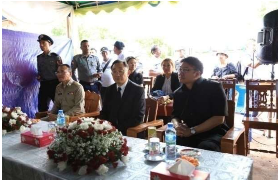
แผนภาพที่ ๙ ภาพการส่งผู้หนีภัยการสู้รบจากเมียนมา กลุ่มนาร์รอง กลับมาตุภูมิ