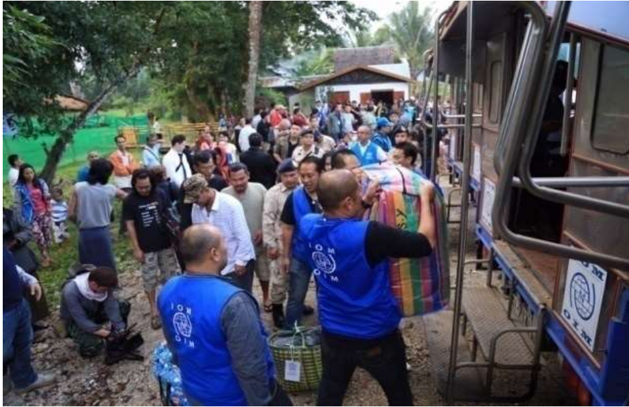
แผนภาพที่ ๑๙ ภาพการส่งผู้หนีภัยการสู้รบจากเมียนมา กลุ่มนาร์อง กลับมาตุภูมิ