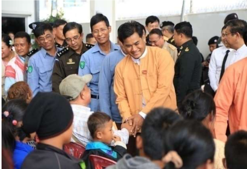
แผนภาพที่ ๕ ภาพการส่งผู้หนีภัยการสู้รบจากเมียนมา กลุ่มนาร่อง กลับมาตุภูมิ