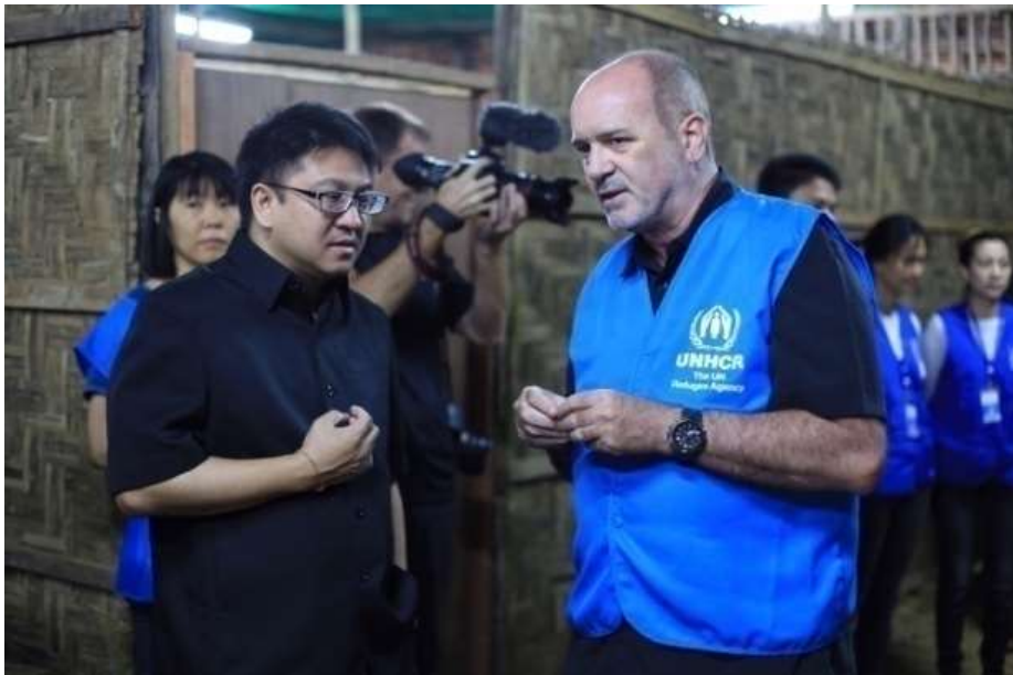
แผนภาพที่ ๒๐ ภาพการส่งผู้หนีภัยการสู้รบจากเมียนมา กลุ่มนาร์อง กลับมาตุภูมิ