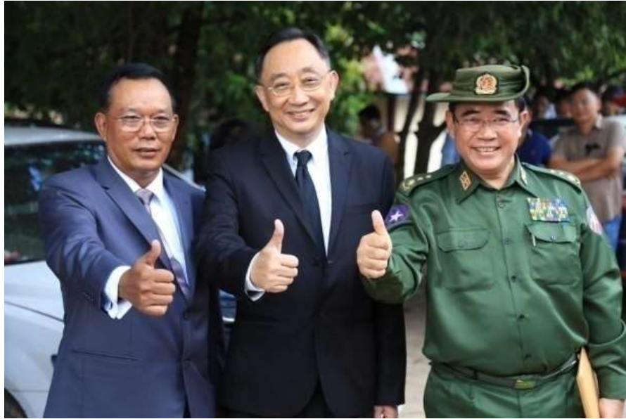
แผนภาพที่ ๑๑ ภาพการส่งผู้หนีภัยการสู้รบจากเมียนมา กลุ่มนาร์อง กลับมาตุภูมิ