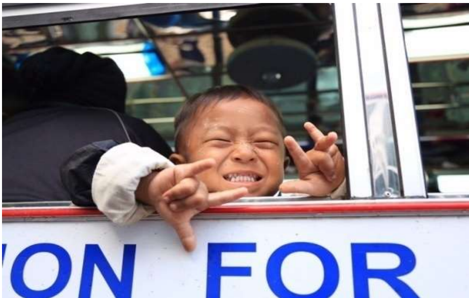
แผนภาพที่ ๔ ภาพการส่งผู้หนีภัยการสู้รบจากเมียนมา กลุ่มนาร่อง กลับมาตุภูมิ