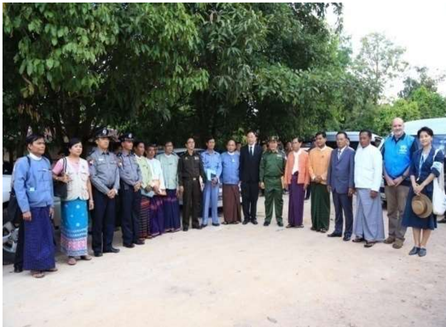
แผนภาพที่ ๑๒ ภาพการส่งผู้หนีภัยการสู้รบจากเมียนมา กลุ่มนาร์อง กลับมาตุภูมิ