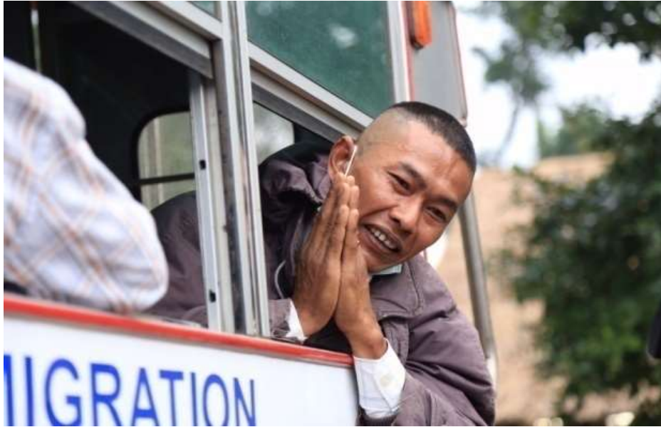
แผนภาพที่ ๑๕ ภาพการส่งผู้หนีภัยการสู้รบจากเมียนมา กลุ่มนาร์รอง กลับมาตุภูมิ