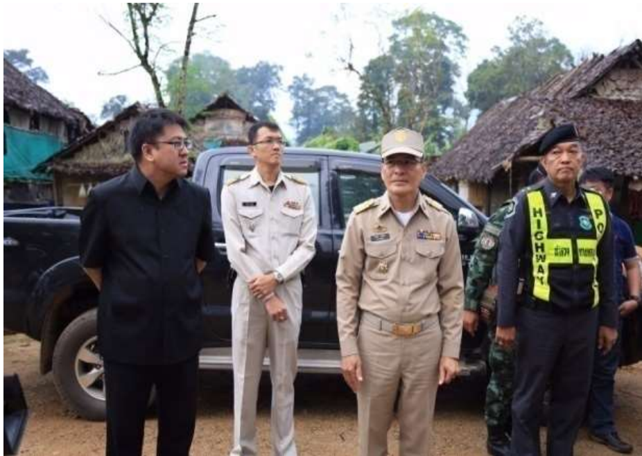
แผนภาพที่ ๑๖ ภาพการส่งผู้หนีภัยการสู้รบจากเมียนมา กลุ่มนาร์รอง กลับมาตุภูมิ