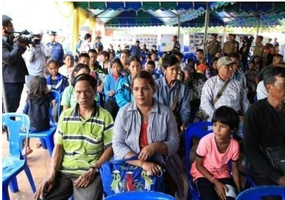
แผนภาพที่ ๘ ภาพการส่งผู้หนีภัยการสู้รบจากเมียนมา กลุ่มนาร์่อง กลับมาตุภูมิ