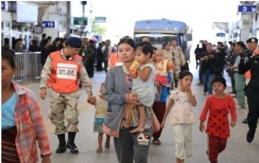
แผนภาพที่ ๖ ภาพการส่งผู้หนีภัยการสู้รบจากเมียนมา กลุ่มนาร่อง กลับมาตุภูมิ