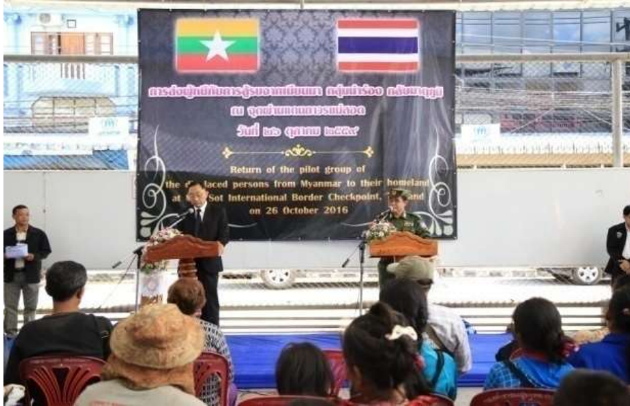
แผนภาพที่ ๗ ภาพการส่งผู้หนีภัยการสู้รบจากเมียนมา กลุ่มนาร์่อง กลับมาตุภูมิ