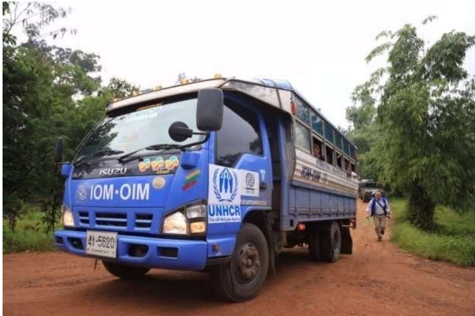
แผนภาพที่ ๑๔ ภาพการส่งผู้หนีภัยการสู้รบจากเมียนมา กลุ่มนาร์รอง กลับมาตุภูมิ