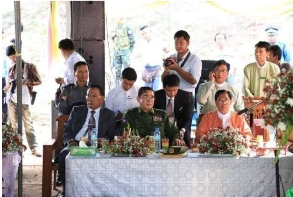
แผนภาพที่ ๑๐ ภาพการส่งผู้หนีภัยการสู้รบจากเมียนมา กลุ่มนาร์รอง กลับมาตุภูมิ