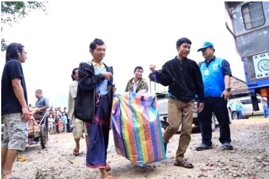
แผนภาพที่ ๑๘ ภาพการส่งผู้หนีภัยการสู้รบจากเมียนมา กลุ่มนาร์อง กลับมาตุภูมิ