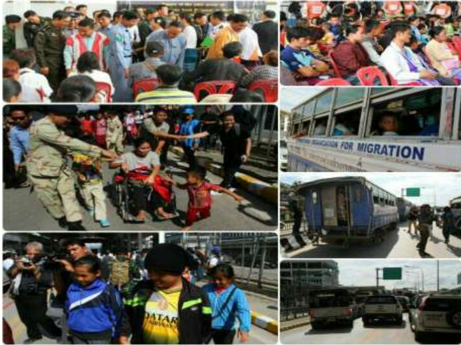
แผนภาพที่ ๓ ภาพการส่งผู้หนีภัยการสู้รบจากเมียนมา กลุ่มนาร่อง กลับมาตุภูมิ