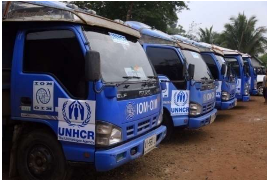
แผนภาพที่ ๑๗ ภาพการส่งผู้หนีภัยการสู้รบจากเมียนมา กลุ่มนาร์อง กลับมาตุภูมิ