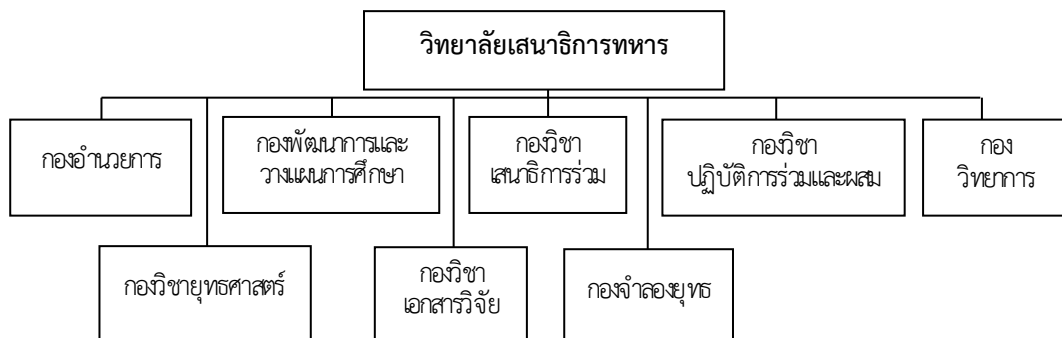
แผนภาพที่ ๓-๑ ผังการจัดวิทยาลัยเสนาธิการทหาร ฯ

๒. การแบ่งส่วนราชการและหน้าที่วิทยาลัยเสนาธิการทหาร มีผังการจัดหน่วยตาม แผนภาพที่ ๓-๑ และแต่ละส่วนราชการมีหน้าที่ ดังนี้ (กองทัพไทย, คำสั่ง, ๒๕๕๙ : ๓๔๗ - ๓๔๘)