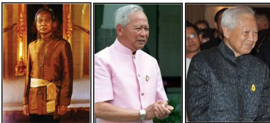
แผนภาพที่ 3 - 8 ภาพชุดพระราชทานแขนยาวมีผ้าคาดเอว ชุดแขนสั้นและชุดแขนยาว