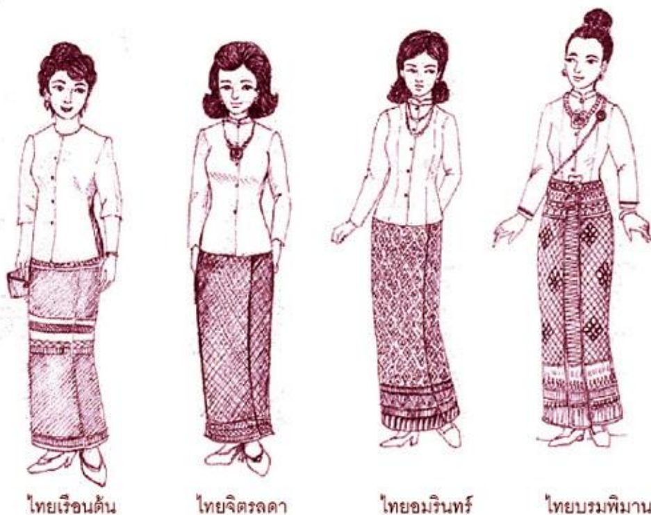
ที่มา : ภาพเขียนเลียนแบบของพวงผกา คุโรวาท 2535

5. ไทยจักรี หรือชุดไทยสไบ นุ่งผ้ามีเชิงหรือยกทั้งตัว ยกจีบข้างหน้า มีชายพก ใช้เข็มขัดไทยคาด ท่อนบนเป็นสไบจะเย็บติดกับชั้นเป็นท่อนเดียวกัน หรือจะมีสไบห่ม ต่างหากก็ได้ เปิดบ่าข้างหนึ่ง ชายสไบคลุมไหล่ ทั้งชายด้านหลัง ยาวตามทีเห็นสมควร (ความสวยงามอยู่ที่เนื้อผ้า การเย็บและรูปทรงของผู้สวม) ใช้เครื่องประดับหิ้งดงามตามโอกาสในเวลากลางคืน ชุดนี้ใช้ในโอกาสพิเศษที่กำหนดให้แต่งกายเต็มยศสำหรับอากาศที่ไม่เย็น