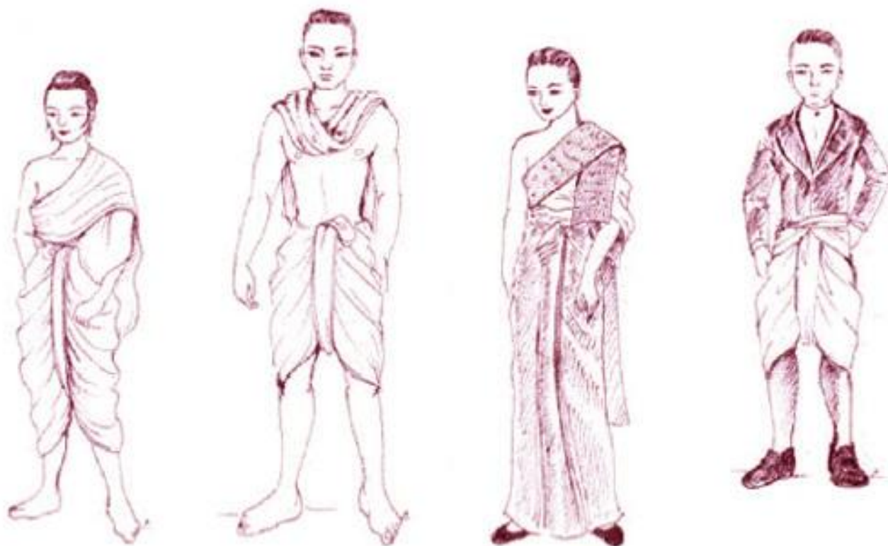
แผนภาพที่ 3 - 1 การแต่งกายสมัยรัชกาลที่ 4 เอาวัฒนธรรมตะวันตกเข้ามาปรับใช้กับวัฒนธรรมเดิมที่มีอยู่ก่อนแล้วเพื่อสร้างความเจริญแก่ประเทศ