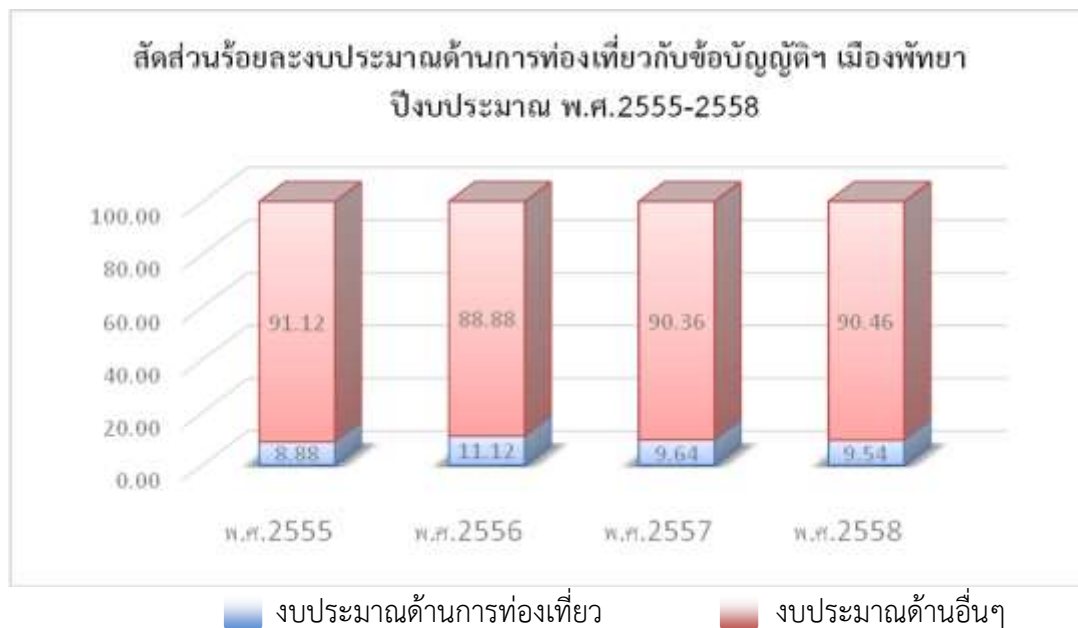
แผนภาพที่ 4-1 สัดส่วนร้อยละงบประมาณด้านการท่องเที่ยวเกี่ยวกับข้อบัญญัติฯ เมืองพัทยา ปีงบประมาณ พ.ศ. 2555 – พ.ศ. 2558