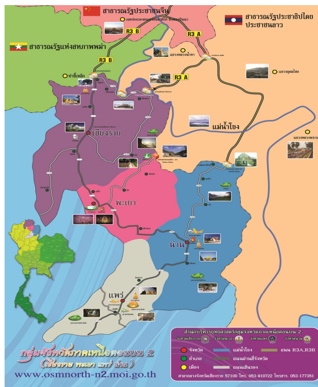
แผนภาพ ที่ 3-1 แสดงแผนที่กลุ่มจังหวัดภาคเหนือ