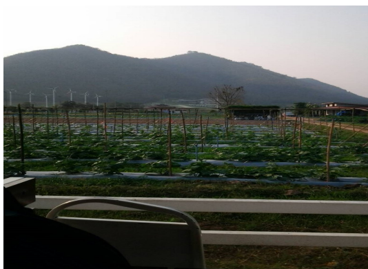
ภาพที่ 3-39 แปลงปลูกเมลอน ซึ่งใช้พลาสติกคลุมดินเพื่อรักษาความชื้น