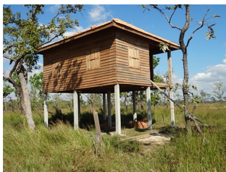
ภาพที่ 3-22 ตัวอย่างบ้านของทหารในพื้นที่ชายแดนจังหวัดอุดรธานี และจังหวัดพระวิหาร (สภาพเมื่อเดือน พฤศจิกายน พ.ศ.2555)