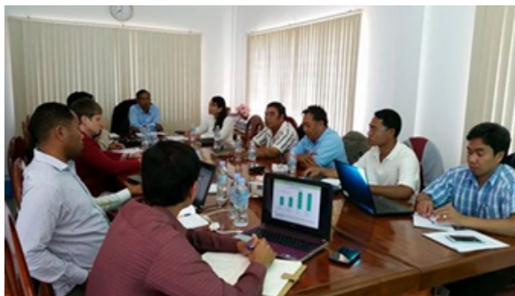
ภาพที่ 3-5 การปรึกษาหารือและวางแผนอย่างต่อเนื่องของตัวแทนจาก FAO CIDO RCEDO KBA Malteser International และตัวแทนสำนักงานจังหวัด ที่สำนักงานจังหวัดอุดรธานี

(Khmer Buddhist Association) Malteser International and FAO ร่วมกับผู้แทนสำนักงานพัฒนาการเกษตรจังหวัดอุดรธานี ได้หารือกันที่สำนักงานจังหวัดอุดรธานี ซึ่งโครงการนี้เป็นการทำงานร่วมกันระหว่างครัวเรือน ชุมชน จังหวัด รัฐบาล และผู้ให้ความช่วยเหลือโครงการ