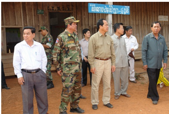
ภาพที่ 3-26 โรงเรียนประถมศึกษาทมอดิน จังหวัดอุดรรัมย์

เมื่อวันที่ 30 มกราคม พ.ศ.2556 นายเจีย โชะพารา รว.กระทรวงพัฒนาชนบท ในฐานะประธานคณะกรรมการร่วมระหว่างกระทรวงเพื่อดำเนินโครงการพัฒนาตามแนวชายแดน ด้านภาคตะวันตกและภาคเหนือของกัมพูชา เป็นประธานการประชุมสรุปผลการปฏิบัติงานประจำปี ที่อำเภอจอมกระสาน จังหวัดพระวิหาร และได้มอบแนวทางสำหรับการปฏิบัติงานใน 2 ประเด็น คือ