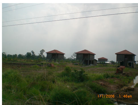
ภาพที่ 3-30 รูปบ้านหลายหลังที่ไม่มีผู้พักอาศัย