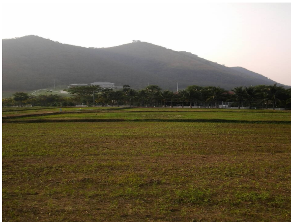
ภาพที่ 3-38 แปลงนา ปลุกสลับกับถั่วเหลือง