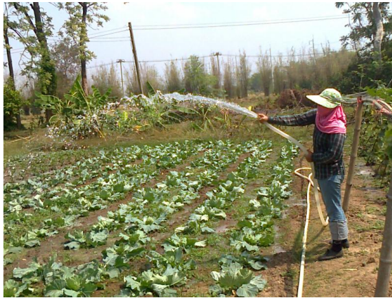
ภาพที่ 3-34 การรดน้ำผักสวนครัวในแปลงผักอนามัยปลอดภัยจากสารพิษ(แปลงทฤษฎีใหม่)