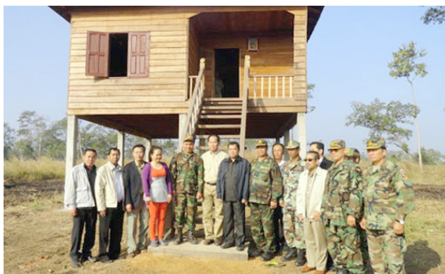
ภาพที่ 3-27 นายเจีย โชะพารา เป็นประธานพิธีมอบบ้าน ในพื้นที่จังหวัดพระวิหาร และ จังหวัดอุดรรัมย์

เมื่อวันที่ 24 ธันวาคม พ.ศ.2556 นายเจีย โชะพารา เป็นประธานพิธีมอบบ้านจำนวน 618 หลัง แก่ครอบครัวทหาร ตำรวจ ในพื้นที่จังหวัดพระวิหาร และ จังหวัดอุดรรัมย์