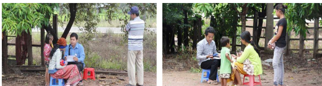
ภาพ 3-14 การสำรวจด้านโภชนาการของโครงการแนะนำส่งเสริมในการให้อาหาร และการพัฒนาความมั่นคงทางอาหาร

ด้านการพัฒนาโภชนาการ เว็บไซต์ MALIS 2nd Newsletter 2013 ได้เสนอรายงานผลการสำรวจ ด้านโภชนาการของโครงการแนะนำส่งเสริมในการให้อาหาร และการพัฒนาความมั่นคงทางอาหาร (The Improved Food Security and Complementary Feeding Counseling (IMCF) project ปี ค.ศ.2012) ในจังหวัดพระวิหารและจังหวัดอุดรมีชัย พื้นที่เป้าหมาย 46 หมู่บ้านจำนวน 23 ครัวเรือน ในแต่ละหมู่บ้าน โดยแบบสอบถามผู้ดูแลเด็กจำนวน 1,078 ราย ผลการสำรวจเด็กอายุตั้งแต่ 6 เดือน – 23 เดือน พบว่า ขาดสารอาหาร มีน้ำหนักและส่วนสูงไม่ได้เกณฑ์มาตรฐาน มีโรคโลหิตจาง โดยพบในเด็กอายุต่ำกว่า 2 ปี เป็นผลจากการขาดความรู้ด้านโภชนาการของมารดา และผู้ดูแลเด็ก และการไม่สามารถเข้าถึงอาหารที่มีคุณภาพ ราษฎรร้อยละ 80 ไม่มีการสุขาภิบาลที่ดี มีผู้อ่านหนังสือออกเพียงร้อยละ 46 โดยรวมทั้งสองจังหวัดมีสถานะด้านโภชนาการที่น่าเป็นห่วง และโครงการดังกล่าวได้ดำเนินการสำรวจต่อในปี พ.ศ.2556 – 2557 เพื่อเป็นข้อมูลในการพัฒนาด้านโภชนาการของกัมพูชาต่อไป