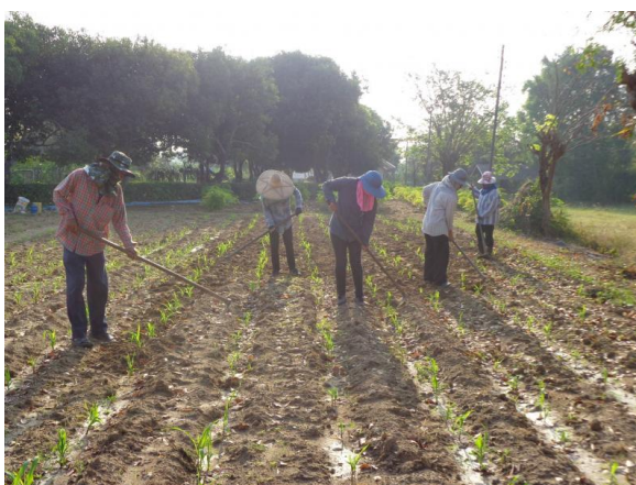
ภาพที่ 3-32 การใส่ปุ๋ยคอกหมักกำจัดวัชพืชในแปลงสาธิตการเกษตรแบบผสมผสาน (จากเว็บไซต์โครงการเมื่อเดือน มกราคม - กุมภาพันธ์ พ.ศ.2558 )