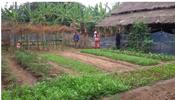
ภาพที่ 3-9 คุณภาพชีวิตที่ดีขึ้นจากรายได้ ในการปลูกข้าว มันสำปะหลัง และพืชไร่

และเมื่อวันที่ 31 มกราคม พ.ศ.2558 เป็นวันปิดการฝึกอบรมการเรียนรู้ของโครงการด้านปลูกพืชผักเกษตรอินทรีย์ ซึ่งเป็นส่วนหนึ่งของการฝึกอบรมด้านวิชาชีพและโภชนาการของโครงการ มีนักเรียนประกอบด้วย เกษตรกร ครู และ เจ้าหน้าที่ท้องถิ่น รวมกว่า 100 คน ได้ร่วมกันแลกเปลี่ยนประสบการณ์ในการเรียนรู้ด้านการเกษตร การจัดการน้ำ และโภชนาการในพื้นที่ตัวอย่างซึ่งอยู่ห่างจากกรุงสำโรง จังหวัดอุดรธานี ประมาณ 5 กิโลเมตร