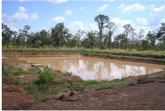
ภาพที่ 3-24 สระเก็บน้ำในพื้นที่หมู่บ้านพัฒนาชายแดนของทหารด้านจังหวัดอุตรดิตถ์ ตรงข้ามจังหวัดสุรินทร์ (สภาพเมื่อเดือน พฤศจิกายน พ.ศ.2555)