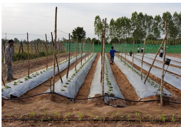
ภาพที่ 3-6 การพัฒนาการเกษตรแบบผสมผสานของโครงการ

ตัวอย่างภาพการพัฒนาการเกษตรตามโครงการเป็นแบบผสมผสาน เช่น การปลูกถั่วฝักยาว ผสมผสานกับแตงกวาในพื้นที่โครงการก่อสร้าง และ อำเภอบันเตีย ออมบิล จังหวัดอุดรธานี ขององค์กร CIDO เมื่อวันที่ 11 พฤศจิกายน พ.ศ.2557