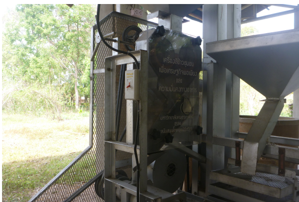
ภาพที่ 3-42 เครื่องสีข้าวชุมชนเพื่อเศรษฐกิจพอเพียงและความมั่นคงทางอาหาร สนับสนุนโดยมหาวิทยาลัยเกษตรศาสตร์ ปี พ.ศ.2554