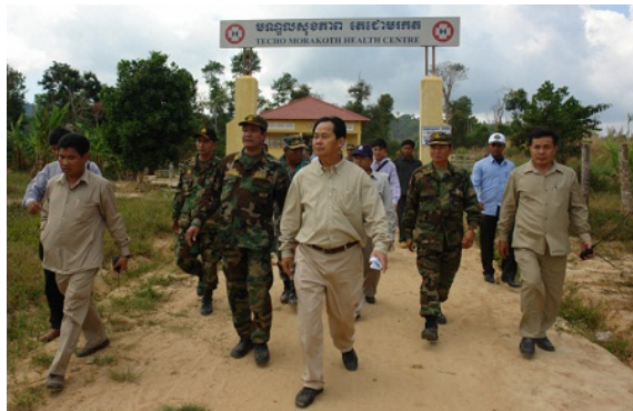
ภาพที่ 3-25 นายเจีย โชะพารา รัฐมนตรีว่าการกระทรวงพัฒนาชนบท ตรวจการก่อสร้างศูนย์สุขภาพเดโชมรกต อำเภोजอมกระสาน จังหวัดพระวิหาร และโรงเรียนประถมศึกษาทมอโตน จังหวัดอุตรดิตถ์ (เมื่อวันที่ 23 มกราคม พ.ศ.2555)