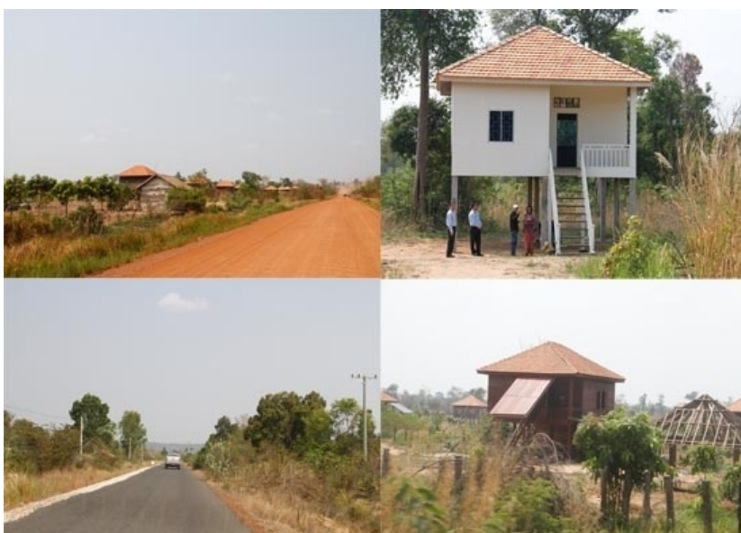
ภาพที่ 3-28 บ้านพักเปลี่ยนวัสดุจากการก่อสร้างด้วยไม้แปรรูปมาใช้วัสดุก่อสร้าง เช่น Smart board แทน

ให้แก่กำลังทหารและครอบครัว ซึ่งที่ประชุมให้เปลี่ยนวัสดุจากการก่อสร้างด้วยไม้แปรรูปมาใช้วัสดุก่อสร้าง เช่น Smart board แทน นอกจากนี้การไฟฟ้าได้วางโครงข่ายสายส่งกระแสไฟฟ้าไว้ในพื้นที่ชายแดนข้างต้นบ้างแล้ว เหลือเพียงการจ่ายกระแสไฟฟ้าตามบ้านเรือนเท่านั้น คาดว่าในปี พ.ศ.2559 ชาวกัมพูชาในพื้นที่จะได้ใช้กระแสไฟฟ้าที่ผลิตในกัมพูชา เป็นกรณีพิเศษไม่ต้องนำเข้ามาจากไทย ซึ่งจะมีการพิจารณาค่ากระแสไฟฟ้าสำหรับครัวเรือนที่ใช้กระแสไฟฟ้าปริมาณน้อย ทั้งนี้จากภาพถ่ายบ้านพักทหารบริเวณชายแดนพื้นที่อำเภอจอมกระสาน มีบางหลังได้เชื่อมต่อสายไฟเข้าบ้านจากเสาไฟฟ้าริมถนน