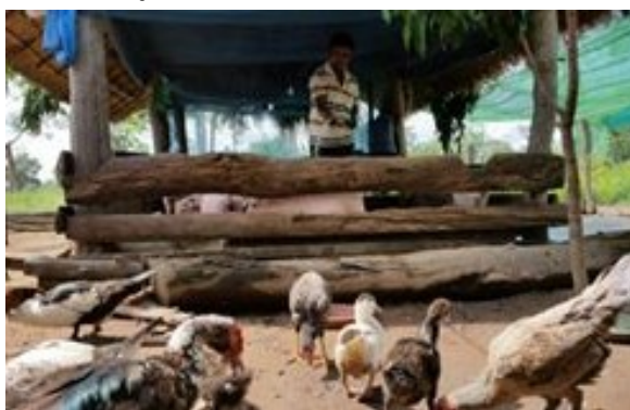
ภาพที่ 3-8 คุณภาพชีวิตที่ดีขึ้นจากรายได้ ในการเลี้ยงสัตว์ ปลูกข้าว มันสำปะหลัง และพืชไร่

ทั้งนี้ผลการดำเนินการหลายโครงการที่ได้รับการสนับสนุนจาก ZOA และ CIDO ในช่วงเวลา 2 - 3 ปีที่ผ่านมา ทำให้ราษฎรชนบทยากจนในพื้นที่ภาคตะวันตกเฉียงเหนือของกัมพูชา กว่า 2,000 ครอบครัว มีคุณภาพชีวิตดีขึ้นจากรายได้ที่เพิ่มอย่างต่อเนื่องผ่านธุรกิจขนาดเล็ก ในการเลี้ยงสัตว์ ปลูกข้าว มันสำปะหลัง และพืชไร่ สามารถเข้าถึงแหล่งทรัพยากรธรรมชาติ แหล่งน้ำ และเพิ่มขีดความสามารถในการต่อสู้กับความหิวโหย