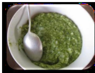
ภาพที่ 3-2 อาหารที่ประกอบใหม่หลังจากได้รับคำแนะนำจากโครงการ