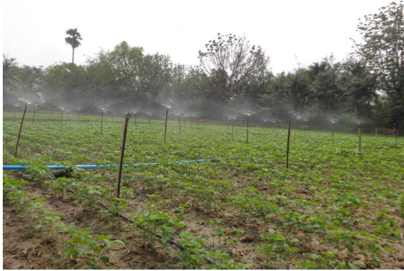
ภาพที่ 3-33 การรดน้ำด้วยเครื่องฝักสดในแปลงนา (แปลงทฤษฎีใหม่)