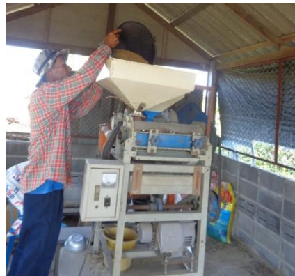
ภาพที่ 3-35 เกษตรกรขนปุ๋ยคอกขึ้นรถเตรียมนำไปใส่แปลงปลูกพืชและมีบริการสีข้าวเปลือกให้ราษฎรบริเวณใกล้เคียง