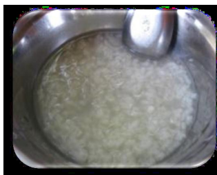
ภาพที่ 3-1 อาหารที่ให้เด็ก เป็นข้าวผสมเกลือ ก่อนที่โครงการจะเข้าไปแนะนำ

กัมพูชาเป็นหนึ่งใน 36 ประเทศ ที่มีปัญหาอย่างสูงด้านโภชนาการในเด็ก และเป็นภาระหนักประการหนึ่งของรัฐบาลกัมพูชา โครงการ MALIS จึงพยายามสนับสนุนการแก้ปัญหาด้านโภชนาการ โดยได้รับเงินช่วยเหลือจากสหภาพยุโรปและเมืองครุฑภาคเอกชนร่วมดำเนินการกับรัฐบาลกัมพูชาในจังหวัดอุดรธานี และยังมีโครงการช่วยเหลือจาก FAO เช่น เมื่อปี พ.ศ.2555 เข้าไปให้ความรู้ด้านโภชนาการ การศึกษาและส่งเสริมให้มีการปรับเปลี่ยนพฤติกรรมด้านการให้อาหารแม่และเด็ก คนในครอบครัว รวมทั้งการประกอบอาหาร การใช้น้ำที่สะอาด เว็บไซต์ของ FAO ได้เสนอรายงานการประชุมโลกเกี่ยวกับการให้นมมารดา ที่กรุงนิวเดลี อินเดีย เมื่อวันที่ 6 – 9 ธันวาคม พ.ศ.2555 เขียนโดย Ellen Muehlhoff ประจำกองคุ้มครองด้านผู้บริโภคและการโภชนาการ ของ FAO ซึ่งให้ความสำคัญต่ออาหารท้องถิ่นและอาหารพื้นเมือง ว่าเป็นสิ่งจำเป็นในการมีส่วนร่วมของโภชนาการเด็ก โดยส่งเสริมการใช้ส่วนประกอบอาหารที่มีคุณค่ามากขึ้น เช่น เนื้อสัตว์ ปลา เมล็ดถั่ว ไข่ ข้าว ผัก น้ำมัน ผสมรวมกัน