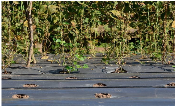
ภาพ 3-17 การใช้พลาสติกคลุมเมล็ดผักที่เริ่มปลูกในสวนเพื่อรักษาความชุ่มชื้นไว้ และเป็นการประหยัดน้ำ