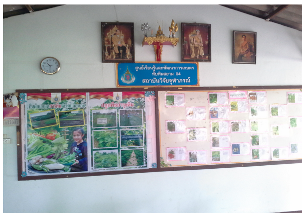
ภาพที่ 3-41 ศูนย์เรียนรู้และพัฒนาการเกษตร ทับทิมสยาม 04 สถาบันวิจัยจุฬาภรณ์

ปัจจุบัน โครงการทับทิมสยาม 04 มีครอบครัวทั้งสิ้น 100 ครัวเรือน ประกอบอาชีพหลักคือ เกษตรกรรม เช่น การปลูกข้าว พืชไร่ พืชสวน เลี้ยงโค กระบือ เป็นต้น ผลการดำเนินงานเป็นที่พอใจ ราษฎรในพื้นที่มีการประกอบอาชีพที่มั่นคง เยาวชนได้รับการศึกษาเป็นอย่างดี