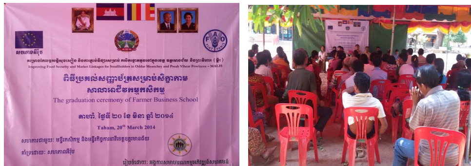
ภาพที่ 3-4 พิธีปิดการอบรมหลักสูตรโรงเรียนธุรกิจชาวนาในจังหวัดอุดรธานีและจังหวัดพระวิหาร

ด้านการพัฒนาการเกษตร โครงการ MALIS ได้เปิดโรงเรียนธุรกิจชาวนา (Farmer Business School) และโรงเรียนชาวนา (Farmer School) เพื่อเป็นแหล่งเรียนรู้ การพัฒนาการเกษตร ให้มีผลผลิตเพิ่มขึ้นและหลากหลาย รู้จักการทำธุรกิจขนาดเล็ก การขยายตลาดการค้า เช่น เมื่อวันที่ 20 มีนาคม พ.ศ.2557 มีพิธีปิดการอบรมหลักสูตรโรงเรียนธุรกิจชาวนาที่จัดอบรมเกษตรกร ในจังหวัดอุดรธานีและจังหวัดพระวิหาร