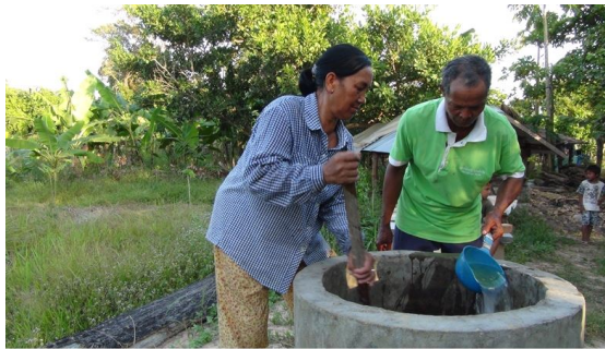
ภาพ 3-18 การผสมขี้วัวในบ่อเพื่อทำให้เกิดก๊าซมีเทนไว้ใช้ทำอาหาร