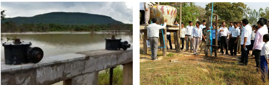
ภาพที่ 3-12 การสร้างเขื่อนกักเก็บน้ำ และประตูปรับน้ำเพื่อส่งน้ำตามท่อไปยังครัวเรือน

ส่วนการช่วยเหลือในการเข้าถึงแหล่งน้ำในพื้นที่จังหวัดอุดรธานี ทูตธุรกิจเนเธอร์แลนด์ของ ZOA ได้สนับสนุนเงินช่วยเหลือสร้างเขื่อนกักเก็บน้ำ และประตูปรับน้ำที่บ้าน Khnach Reusei ซึ่งราษฎรกว่า 200 ครอบครัว ได้รับประโยชน์จากการจัดการน้ำด้านชลประทาน ที่ส่งน้ำตามท่อไปยังครัวเรือนและพืชสวนไร่นา