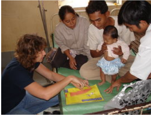
ภาพที่ 3-3 การส่งเสริมสุขภาพแม่และเด็ก

ด้านการพัฒนาการเกษตร โครงการ MALIS ได้เปิดโรงเรียนธุรกิจชาวนา (Farmer Business School) และโรงเรียนชาวนา (Farmer School) เพื่อเป็นแหล่งเรียนรู้ การพัฒนาการเกษตร ให้มีผลผลิตเพิ่มขึ้นและหลากหลาย รู้จักการทำธุรกิจขนาดเล็ก การขยายตลาดการค้า เช่น เมื่อวันที่ 20 มีนาคม พ.ศ.2557 มีพิธีปิดการอบรมหลักสูตรโรงเรียนธุรกิจชาวนาที่จัดอบรมเกษตรกร ในจังหวัดอุดรธานีและจังหวัดพระวิหาร