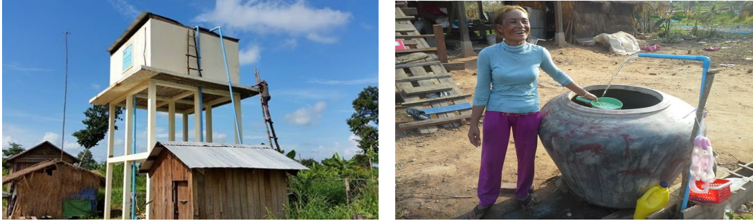
ภาพที่ 3-13 การช่วยเหลือโครงการชลประทาน น้ำ และสุขาภิบาล จังหวัดอุดรธานี

นอกจาก ZOA และ CIDO แล้ว ยังมีความช่วยเหลือจาก The Australian Department of Foreign Affairs and Trade (DFAT) อีกโครงการหนึ่งเมื่อปี พ.ศ.2550 ที่ให้ความช่วยเหลือด้านน้ำ สุขาภิบาลและสุขอนามัยแก่นักเรียนในโรงเรียน Prey จังหวัดอุดรธานี