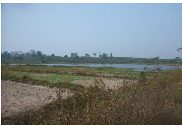
ภาพที่ 3-43 แหล่งน้ำในโครงการฯ