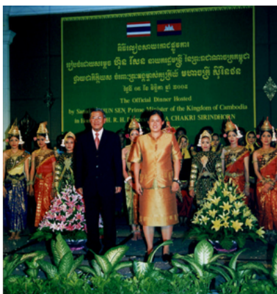
ภาพที่ 3-44 ทรงเปิดวิทยาลัยกำปงเฌอเดีล

แนวพระราชดำริในการจัดการศึกษา ทรงเน้นความสำคัญในประเด็นต่าง ๆ ดังนี้