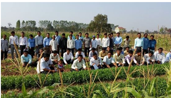
ภาพที่ 3-10 การฝึกอบรมการเรียนรู้ของโครงการด้านปลูกพืชผักเกษตรอินทรีย์

และเมื่อวันที่ 31 มกราคม พ.ศ.2558 เป็นวันปิดการฝึกอบรมการเรียนรู้ของโครงการด้านปลูกพืชผักเกษตรอินทรีย์ ซึ่งเป็นส่วนหนึ่งของการฝึกอบรมด้านวิชาชีพและโภชนาการของโครงการ มีนักเรียนประกอบด้วย เกษตรกร ครู และ เจ้าหน้าที่ท้องถิ่น รวมกว่า 100 คน ได้ร่วมกันแลกเปลี่ยนประสบการณ์ในการเรียนรู้ด้านการเกษตร การจัดการน้ำ และโภชนาการในพื้นที่ตัวอย่างซึ่งอยู่ห่างจากกรุงสำโรง จังหวัดอุดรธานี ประมาณ 5 กิโลเมตร