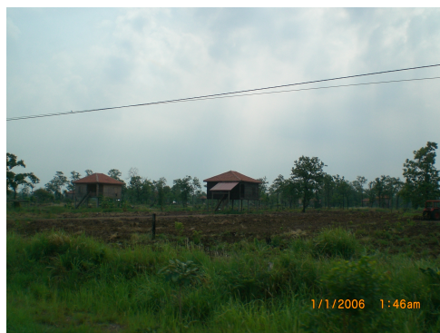
ภาพที่ 3-29 รูปบ้านพักทหารในพื้นที่ใกล้กับบ้านสะแอม อำเภोजอมกระสาน มีการปลูกมะม่วง และ กลบไถดินเพื่อเตรียมเพาะปลูก และบางบ้านโยงสายไฟชั่วคราวเข้าบ้านจากริมถนน