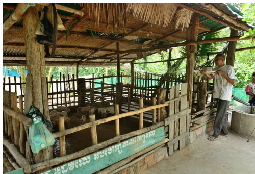
ภาพ 3-21 นายนวน ชุน ชาวนา เลี้ยงหมูในบริเวณหลังบ้าน

กล่าวโดยสรุป โครงการพัฒนาชนบทด้านการเกษตร สาธารณสุข และการจัดการแหล่งน้ำที่กล่าวมาแล้ว ในพื้นที่จังหวัดอุดรธานีและจังหวัดพระวิหาร ได้มุ่งเป้าไปสู่เกษตรกรและชาวชนบททั่วไปที่อยู่ห่างไกลและยากจนเหมือนเช่นในพื้นที่จังหวัดอื่นๆ รวมทั้งการพัฒนาความเป็นอยู่ของแม่และเด็ก เพื่อให้มีการพัฒนาเพื่อเพิ่มผลผลิต มีรายได้เพิ่มขึ้น มีสุขอนามัยและโภชนาการดีขึ้น มีการปรับตัวกับสภาพภูมิอากาศ เพื่อนำไปสู่การพัฒนาอย่างยั่งยืนต่อไป ซึ่งยังเป็นปัญหาท้าทายของรัฐบาลกัมพูชาและจังหวัดในการปรับแผนงานให้ตรงกับความต้องการและสภาพที่แท้จริงในท้องถิ่น