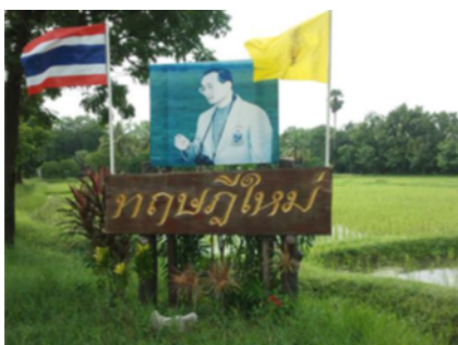
ภาพที่ 3-31 ป้ายทฤษฎีใหม่ในโครงการพัฒนาพื้นที่บริเวณวัดมงคลชัยพัฒนา จังหวัดสระบุรี

เมื่อวันที่ 3 ตุลาคม พ.ศ.2535 เป็นต้นมา พระบาทสมเด็จพระเจ้าอยู่หัว ได้พระราชทานดำริให้ทำการทดลอง “ทฤษฎีใหม่” ขึ้นที่ วัดมงคลชัยพัฒนา อำเภอเฉลิมพระเกียรติ ซึ่งนับเป็นทฤษฎีใหม่แห่งแรกของประเทศไทย ด้วยหลักการง่ายๆ ให้เป็นแนวทางปฏิบัติ โดยเริ่มจาก สภาพความจริงที่ว่าราษฎรหนึ่งครอบครัวมีที่ดินเฉลี่ยประมาณ 10 - 15 ไร่ จะสามารถมีน้ำใช้เพื่อการเกษตรอย่างเพียงพอตลอดปี และใช้น้ำกับที่ดินที่มีอยู่ให้เกิดประโยชน์สูงสุด เพื่อให้มีกินแบบตามอัตภาพ คือ ไม่ได้รวยมากแต่พอกิน ไม่อดอยาก มีการแบ่งที่ดินที่ถือครองออกเป็นสัดส่วน โครงการนี้ มีการดำเนินงานเป็นศูนย์สาธิตการดำเนินเกษตรทฤษฎีใหม่อย่างเป็นรูปธรรมสามารถนำไปประยุกต์ใช้ได้จริงในพื้นที่ของราษฎรและเกษตรกรโดยทั่วไป สามารถพึ่งพาตนเองได้อย่างมีประสิทธิภาพ