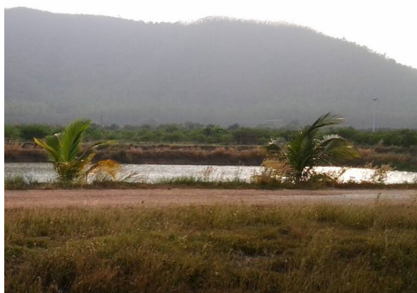
ภาพที่ 3-40 สระเก็บน้ำในพื้นที่โครงการ เพื่อใช้เพาะปลูก และเลี้ยงสัตว์