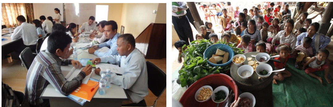
ภาพ 3-15 การจัดตั้งโรงเรียนชานาและโรงเรียนธุรกิจชานา

นอกจากนั้นเว็บไซต์ของ UNDP เมื่อปี พ.ศ.2557 ได้รายงานเกี่ยวกับการจัดทำโครงการส่งเสริมการเรียนรู้เพื่อปรับให้เข้ากับสภาพภูมิอากาศที่เปลี่ยนแปลงโดยพัฒนาแหล่งน้ำและการเกษตร ในพื้นที่ชนบทของจังหวัดพระวิหาร และ จังหวัดกรอแจะ ซึ่งโครงการนี้มีชื่อว่า The project – Promoting Climate Resilient Water Management and Agricultural Practices in Rural Cambodia ตอบสนองโครงการปฏิบัติการของรัฐบาลกัมพูชาในการปรับตัว เข้ากับสภาพภูมิอากาศ (Cambodia’s National Adaptation Programme of Action to Climate Change หรือ NAPA) ตามความร่วมมือกับสหประชาชาติ ซึ่งมีการดำเนินการมาอย่างต่อเนื่อง ภายใต้การสนับสนุนของโครงการพัฒนาแห่งสหประชาชาติ และรัฐบาลกัมพูชากับผู้ให้ความช่วยเหลืออีกหลายราย