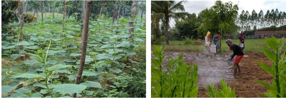
ภาพที่ 3-11 เกษตรกร และนักเรียนกำลังเรียนรู้วิธีทำยาฆ่าแมลงด้วยสารอินทรีย์ชีวภาพ

Green Shoots Foundation ยังทำงานร่วมกับองค์กรเอกชนผู้สนับสนุนรายอื่นๆ คือ Pilot Enfants du Mékong - Officiel, Children of the Mekong และ CIDO ทำให้ครูและนักเรียนที่เข้าร่วมโครงการมีวิชาชีพ และมีอาหารที่ดีต่อสุขภาพ และเมื่อวันที่ 15 พฤศจิกายน พ.ศ.2557 เว็บไซต์ของ Green Shoots Foundation ได้กล่าวถึงการจัดทำโครงการให้ความช่วยเหลือดังกล่าวใน 42 โรงเรียน โดยทำแปลงสวนตัวอย่างในการปลูกพืชผัก ผลไม้ ในสภาพแวดล้อมที่เหมาะสม และเว็บไซต์ของ Green Shoots Foundation ได้ประกาศหาผู้สมัครร่วมโครงการก่อสร้างสระเก็บน้ำชุมชนรวม 22 แห่ง ในพื้นที่สองอำเภอดังกล่าว (กำหนดเริ่มโครงการวันที่ 9 กุมภาพันธ์ พ.ศ.2558)