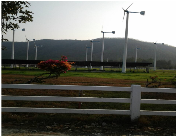
ภาพที่ 3-37 กังหันลมในพื้นที่โครงการซึ่งใช้ผลิตพลังงานไฟฟ้าทดแทน