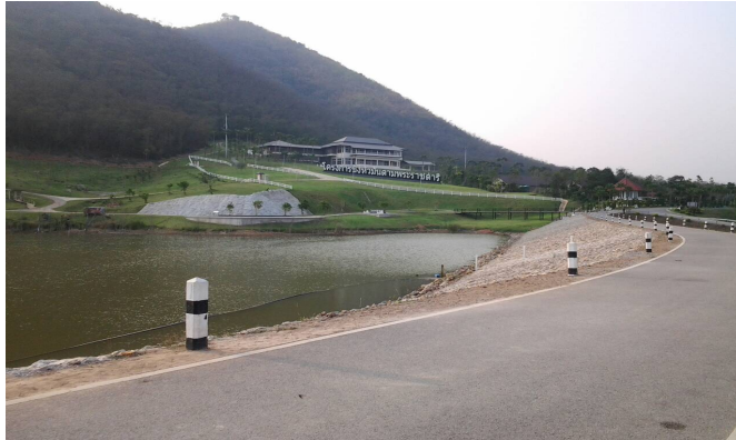
ภาพที่ 3-36 บริเวณด้านหน้าโครงการชั่งหัวมัน ตามพระราชดำริ