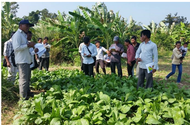
ภาพที่ 3-7 การเยี่ยมชมโครงการปลูกพืชเกษตรอินทรีย์ ภายใต้การสนับสนุนของ CIDO

นอกจากนี้ในพื้นที่อำเภอบันเตีย ออมบิล กลุ่มเกษตรกรชุมชน 3 กลุ่ม ในพื้นที่ Koak Mon, Taham, Koak A'loak ซึ่งจัดตั้งมาตั้งแต่ปี พ.ศ.2552 โดยการสนับสนุนเงินช่วยเหลือการดำเนินงานของกลุ่มโดยทูตธุรกิจเนเธอร์แลนด์ของ ZOA ประจำกัมพูชา สหภาพยุโรป และองค์การเอกชน Malteser International ของสาธารณรัฐมอลตา รวมทั้งโครงการ MALIS และ CIDO ได้มีวางแผนงานร่วมกันในอนาคต เมื่อวันที่ 24 มกราคม พ.ศ.2558 เพื่อพัฒนาบุคลากรที่มีสมาชิกมากกว่า 500 คน