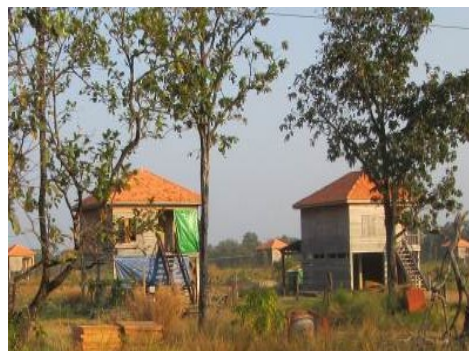
ภาพที่ 3-23 ตัวอย่างบ้านของทหารในพื้นที่ชายแดนจังหวัดอุดรธานี - จังหวัดพระวิหาร (สภาพเมื่อปี พ.ศ.2557)