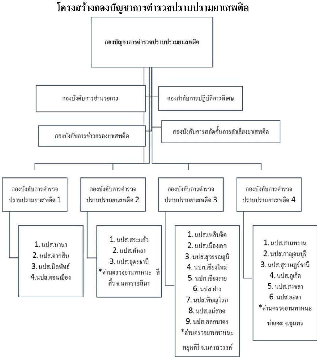
แผนภาพที่ 3-1 แสดงโครงสร้างการแบ่งส่วนราชการกองบัญชาการตำรวจปราบปรามยาเสพติด