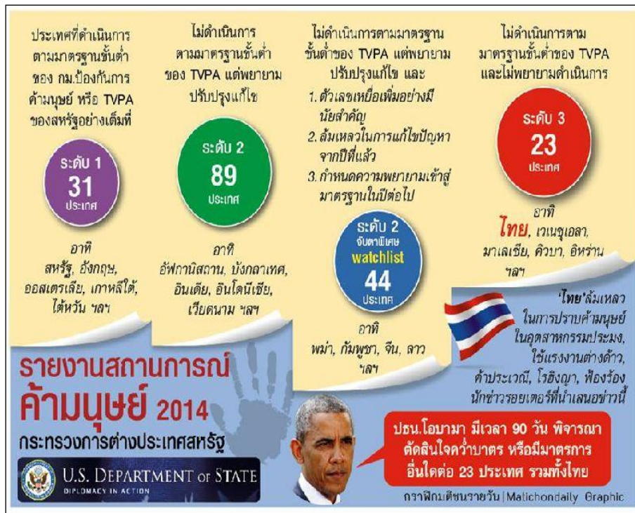
แผนภาพที่ 2-2 : รายงานสถานการณ์ค้ามนุษย์ 2014

4. เป็นกฎหมายที่สามารถดำเนินการได้ทั้งต่อผู้ค้ามนุษย์รายใหญ่และรายย่อย รวมทั้งมี มาตรการติดตาม ดูแลปกป้องผู้เสียหายจากการค้ามนุษย์ อันเป็นตัวอย่างที่ดีในการออกกฎหมาย ป้องกันและปราบปรามการค้ามนุษย์ของไทยในเวลาต่อมา