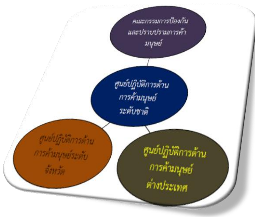
แผนภาพที่ 3-2 : แสดง โครงสร้างศูนย์ปฏิบัติการด้านการค้ามนุษย์

ที่มา : ศูนย์ปฏิบัติการป้องกันและปราบปรามการค้ามนุษย์แห่งชาติ กระทรวงการพัฒนาสังคมและความมั่นคงของมนุษย์.