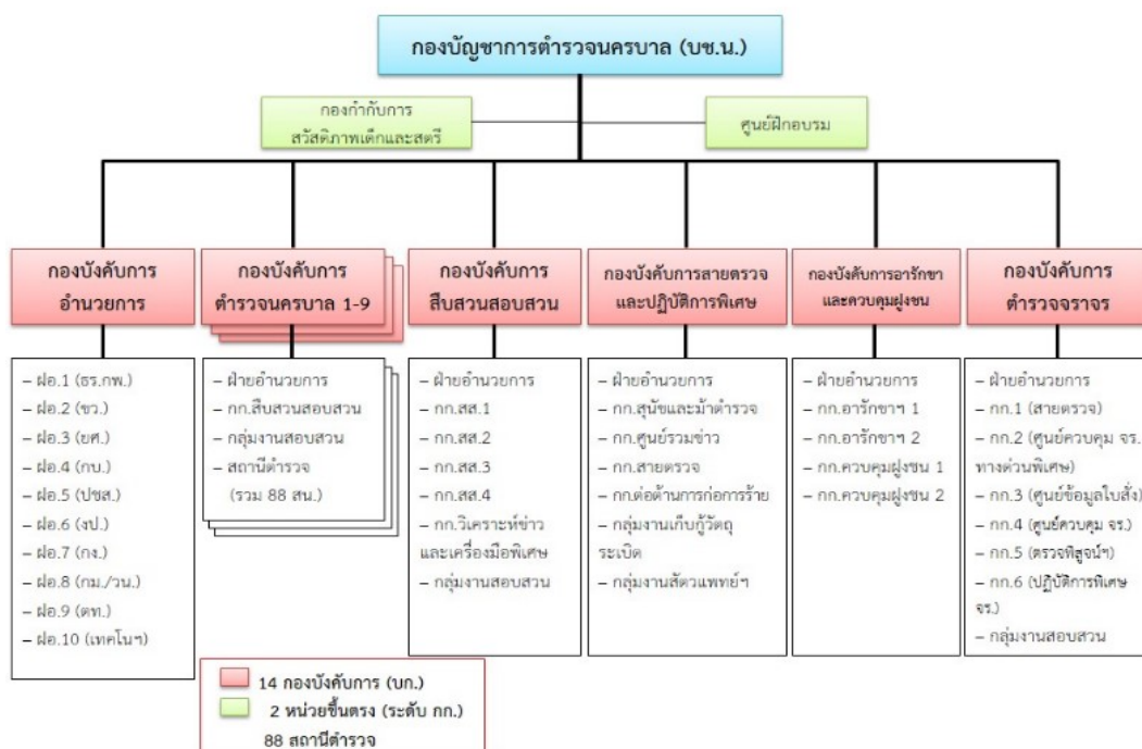
แผนภาพที่ 2-1 โครงสร้างการบังคับบัญชาของกองบัญชาการตำรวจนครบาล

โครงสร้างการบังคับบัญชาของกองบัญชาการตำรวจนครบาล ปรากฏรายละเอียดตามภาพประกอบ ดังนี้