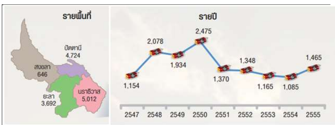
แผนภาพที่ ๒ - ๑ สถิติเหตุการณ์ความรุนแรง ตั้งแต่ปี ๒๕๔๗ ถึง ปี ๒๕๕๕