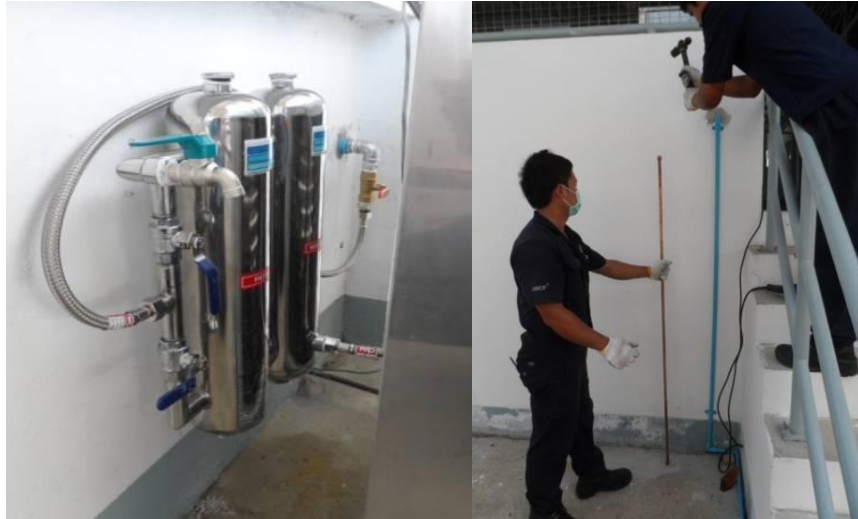
แผนภาพที่ 4-3 : ภาพการเปลี่ยนเครื่องกรองน้ำดื่ม หลักดินและสายดินใหม่

4.3.3 ดำเนินการปรับความสูงของหลอดไฟบนเพดาน บริเวณสถานที่ปฏิบัติงานของผู้ต้องขัง จากเดิมสูงจากพื้น 3 เมตร วัดค่าความเข้มของแสงได้ 500 ลูเมน เป็น 2.50 เมตร วัดค่าความเข้มของแสงได้ 750 ลูเมน