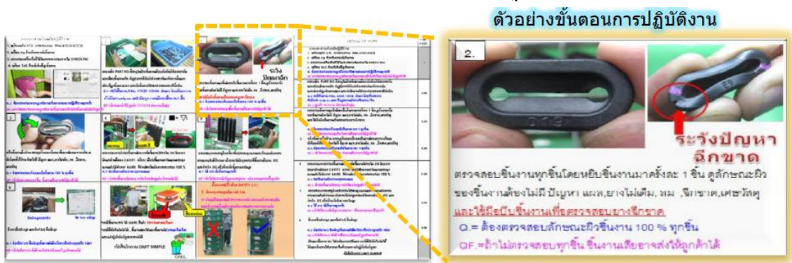
แผนภาพที่ 3-2 : ตัวอย่างเอกสารแสดงวิธีการปฏิบัติงาน (WI)