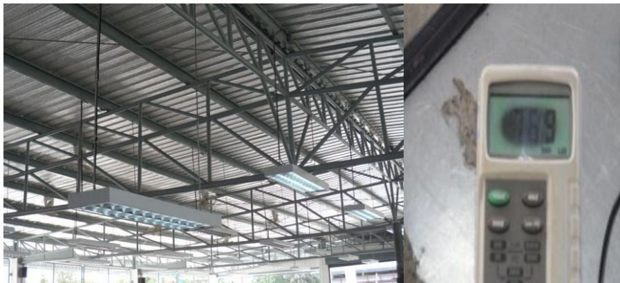
แผนภาพที่ 4-4 : ภาพความสูงของหลอดไฟบนเพดานหลังการแก้ไข

4.3.3 ดำเนินการปรับความสูงของหลอดไฟบนเพดาน บริเวณสถานที่ปฏิบัติงานของผู้ต้องขัง จากเดิมสูงจากพื้น 3 เมตร วัดค่าความเข้มของแสงได้ 500 ลูเมน เป็น 2.50 เมตร วัดค่าความเข้มของแสงได้ 750 ลูเมน