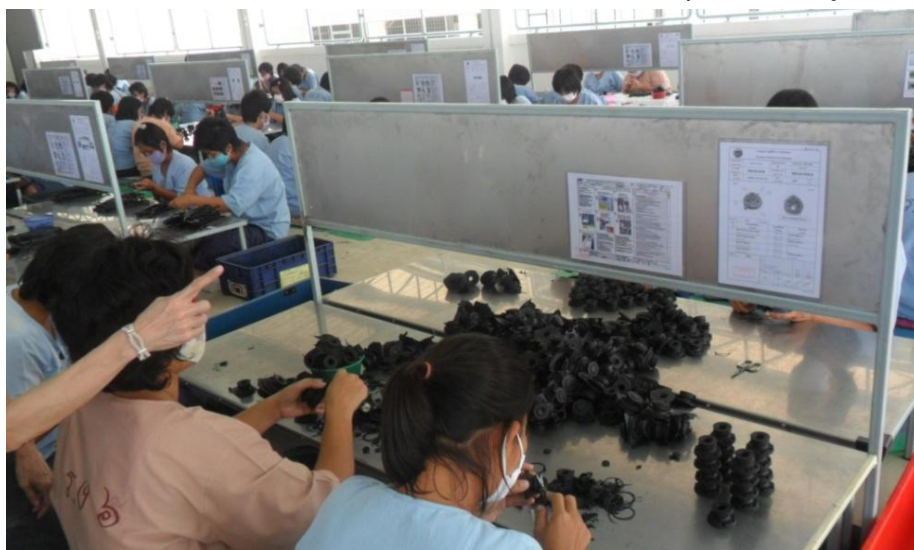
แผนภาพที่ 3-1 : ภาพแสดงสถานที่และลักษณะการปฏิบัติงานของผู้ต้องขัง

เมื่อผู้ต้องขังปฏิบัติงานเสร็จสิ้นในช่วงกลางวันและเย็น ผู้คุมจะนับจำนวนอุปกรณ์ทุกคนให้ครบตามจำนวนที่บันทึกไว้ โดยผู้ต้องขังแต่ละคนมีหน้าที่ต้องดูแลรักษาอุปกรณ์ในการปฏิบัติงานของตนเองไม่ให้ชำรุดหรือสูญหาย หากมีอุปกรณ์ชิ้นใดสูญหายไปแม้เพียง 1 ชิ้น ผู้คุมจะไม่อนุญาตให้ผู้ต้องขังดำเนินกิจกรรมอื่นๆต่อ จนกว่าจะหาอุปกรณ์นั้นเจอ โดยผู้ต้องขังเจ้าของอุปกรณ์ชิ้นนั้นจะได้รับการลงโทษตามกฎระเบียบ เนื่องจากอุปกรณ์เหล่านี้สามารถนำไปประยุกต์ใช้เป็นอาวุธได้