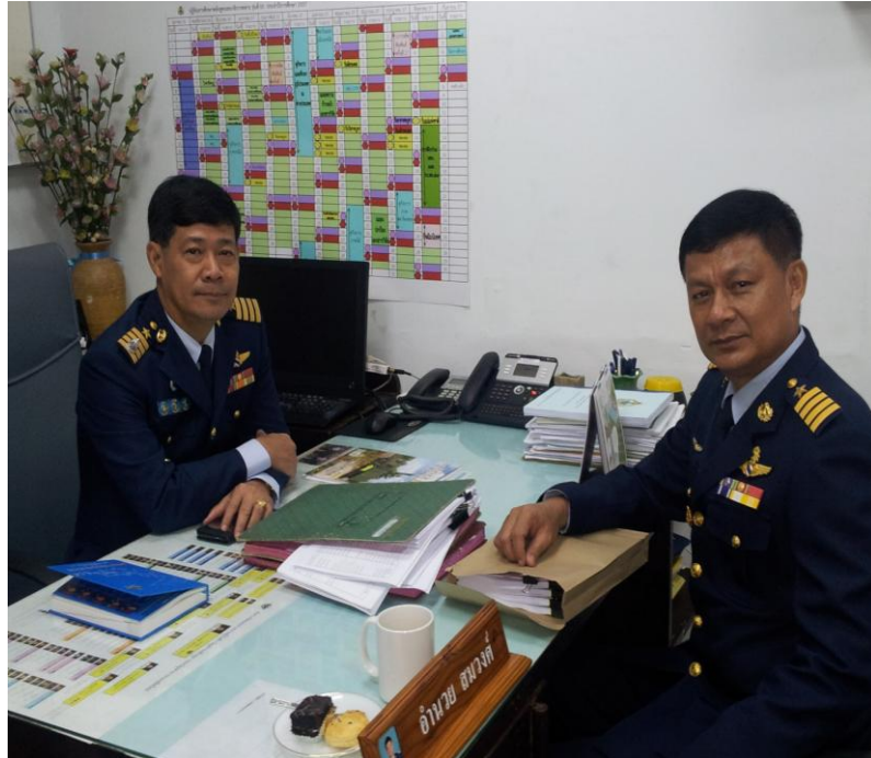
นาวาอากาศเอก วีรพงษ์ นิตจินดา รองเจ้ากรมกำลังพลทหารอากาศ