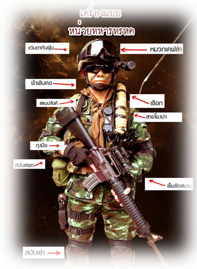
ภาพที่ ๔-๒ เครื่องแต่งกาย (เครื่องแบบหน่วยทหารพราน)