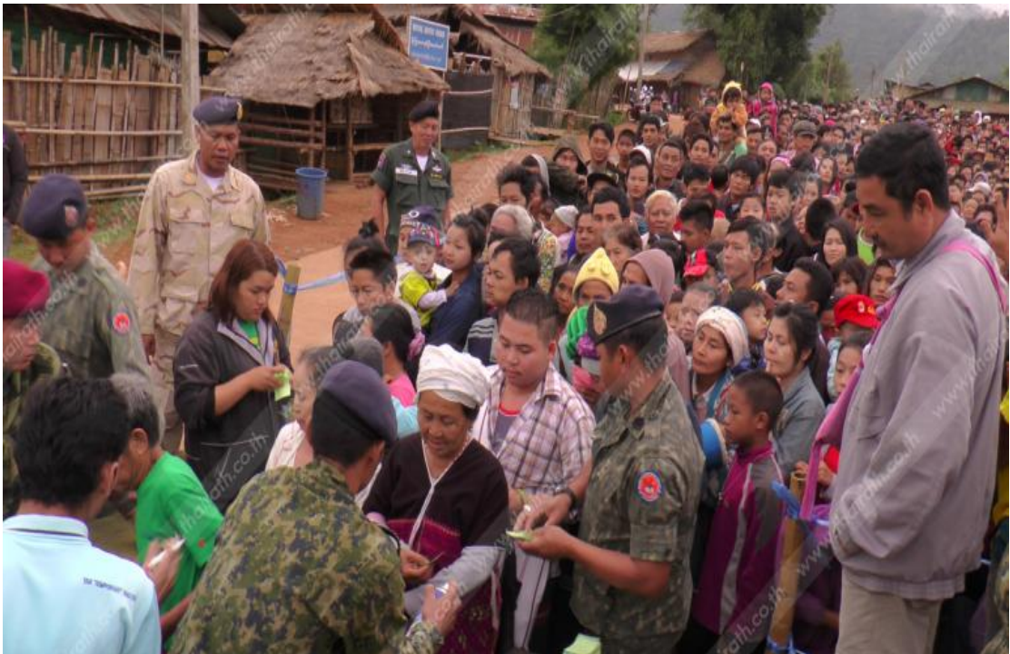
แผนภาพที่ ๔-๕ ภาพการจัดระเบียบผู้หนีภัยฯ ณ พื้นที่พักพิงบ้านอู๋เปี่ยม จังหวัดตาก