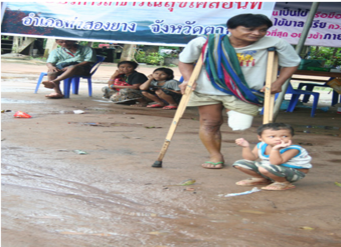
แผนภาพที่ ๔-๗ ภาพผู้หนีภัยฯ ที่อาศัยอยู่ในพื้นที่พักพิงอำเภอท่าสองยาง จังหวัดตาก