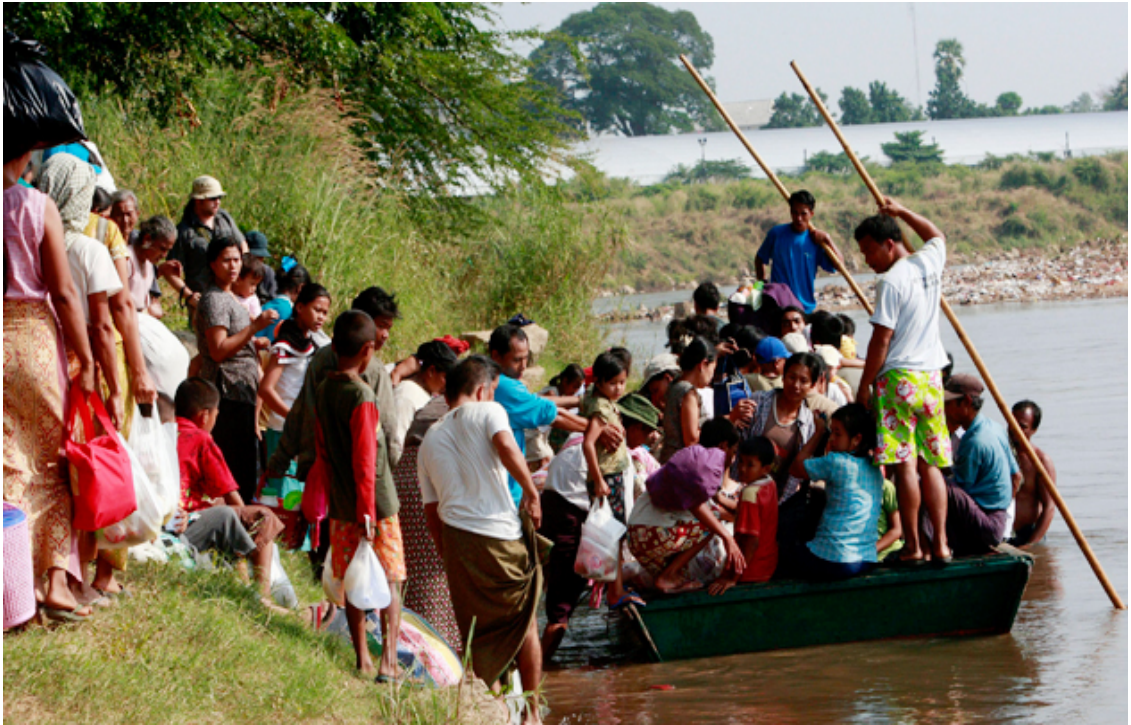
แผนภาพที่ ๔-๒ ภาพผู้หนีภัยฯ จากเมียนมาร์ทะลักเข้ามายังชายแดนไทย