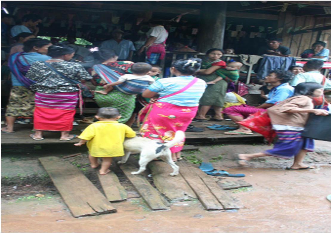
แผนภาพที่ ๔-๖ ภาพผู้หนีภัยฯ ที่อาศัยอยู่ในพื้นที่พักพิงอำเภอท่าสองยาง จังหวัดตาก