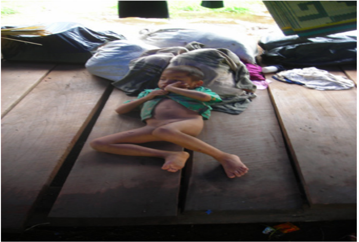
แผนภาพที่ ๔-๘ ภาพผู้หนีภัยฯ ที่อาศัยอยู่ในพื้นที่พักพิงอำเภอท่าสองยาง จังหวัดตาก