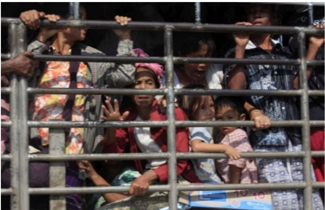
แผนภาพที่ ๔-๓ ภาพผู้หนีภัยฯ จากเมียนมาร์ทะลักเข้ามายังชายแดนไทย