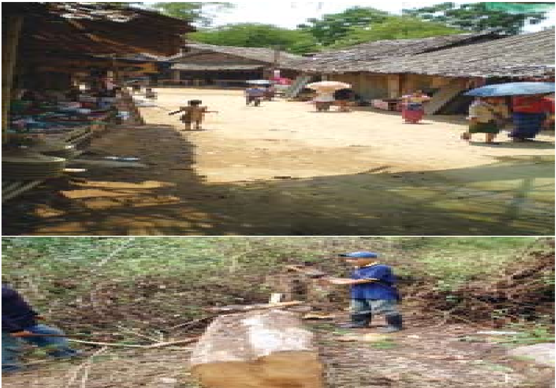
แผนภาพที่ ๔-๑๐ ภาพปัญหาการทำลายทรัพยากรธรรมชาติและสภาพแวดล้อม

ทางการได้ควบคุมดูแลคนเหล่านี้ไว้ไม่ให้ดำเนินการเคลื่อนไหวกว้างไกลหรือดำเนินการใด ๆ ที่ขัดต่อกฎหมายและได้กำหนดนโยบายและมาตรการการควบคุมและช่วยเหลือ ดังนี้ (กระทรวงมหาดไทย : แนวทางปฏิบัติต่อองค์กรพัฒนาเอกชนที่ปฏิบัติงานให้ความช่วยเหลือผู้หลบหนีภัยการสู้รบจากพม่า)