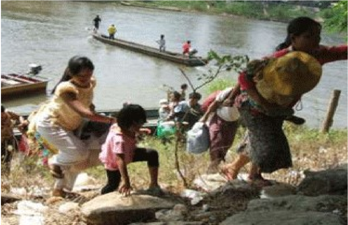
แผนภาพที่ ๔-๔ ภาพผู้หนีภัยฯ จากเมียนมาร์ทะลักเข้ามายังชายแดนไทย