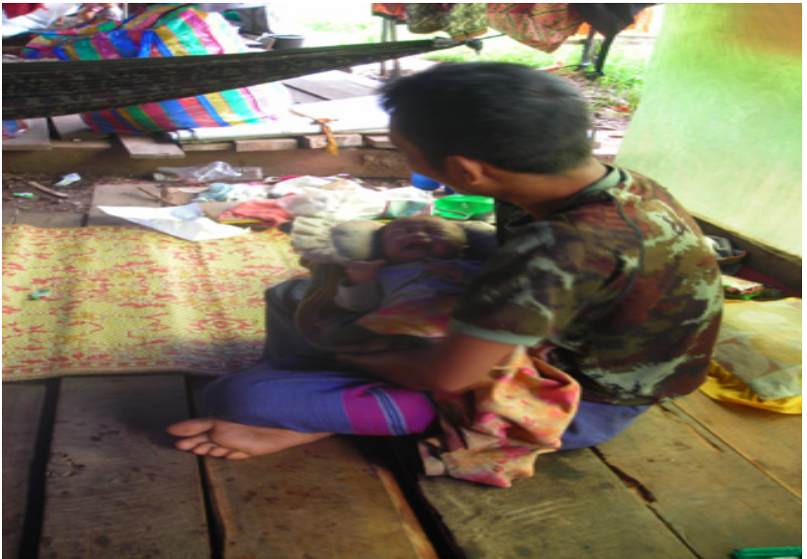
แผนภาพที่ ๔-๙ ภาพผู้หนีภัยฯ ที่อาศัยอยู่ในพื้นที่พักพิงอำเภอท่าสองยาง จังหวัดตาก