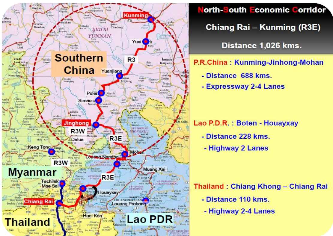
แผนภาพที่ 7 เส้นทาง R3 (คุนหมิง-เซียงรุ่ง) : R3A (R3E) / R3B (R3W)

เป็นทางด่วน 2 ช่องจราจร ซึ่งเมืองบ่อหานนี้จะเป็นพรมแดนของจีนที่ติดกับพรมแดนของ สปป.ลาว คือ บ้านบ่อเต็น แล้วต่อไปยัง บ้านห้วยทราย ซึ่งเส้นทางระหว่างบ้านบ่อเต็นไปยังบ้านห้วยทราย ใน สปป.ลาว ก่อสร้างเป็นทางหลวง (Highway) 2 ช่องจราจร ระยะทาง 228 กิโลเมตร เส้นทาง R3A นี้ จะเชื่อมต่อกับสะพานมิตรภาพ ไทย-ลาว แห่งที่ 4 เชื่อมระหว่างบ้านห้วยทราย กับ อำเภอเชียงของ จังหวัดเชียงราย นอกจากนี้ยังมีอีกเส้นทางที่แยกออกจากเส้น R3 ที่เมืองเซียงรุ่งไปทางทิศตะวันตก เรียกว่า R3B (เดิมคือ R3W) ซึ่งเชื่อมระหว่างเมืองเซียงรุ่งกับเมือง ต้าลั่ว (Daluo) ชายแดนจีนติดกับเมียนมา ระยะทาง 130 กิโลเมตร เป็นทางด่วน 2 ช่องจราจร แล้วเชื่อมต่อไปยังเมืองเซียงตุง-ท่าซี้เหล็ก รวมระยะทาง 248 กิโลเมตร แล้วจึงเข้ามาที่ อำเภอแม่สาย จังหวัดเชียงราย ซึ่งทั้งสองเส้นทางนี้ เส้นทาง R3A จะเป็นเส้นทางที่ ผู้หลบหนีฯ จากเกาหลีเหนือใช้มากที่สุด นอกจากนี้แล้วในอดีตยังปรากฏการเดินทางโดยทางน้ำ ตามรายละเอียดในบทที่ 3