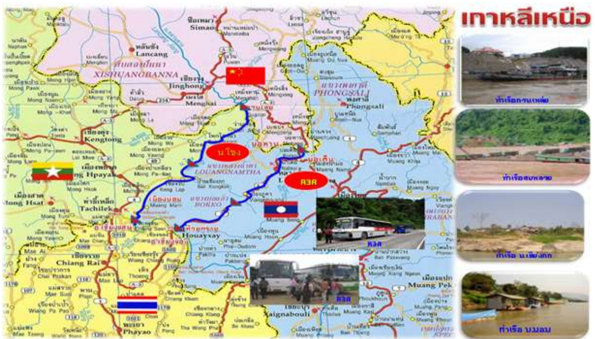
แผนภาพที่ 4 เส้นทางการหลบหนีจากเกาหลีเหนือเข้าสู่ประเทศไทย

เส้นทางการเดินทางมายังประเทศไทย เริ่มจากการลักลอบเดินทางเข้าสู่ประเทศจีน แล้วเดินทางไปยังเมืองเชียงรุ่ง สิบสองปันนา มณฑลยูนนาน เพื่อลักลอบเดินทางออกจากประเทศจีน 2 เส้นทาง โดยเส้นทางที่ 1 จะเดินทางผ่านเมืองต้าหม่งลง (ชายแดนจีน-เมียนมา) เข้าสู่เขตอิทธิพลของว้า แล้วไปลงเรือที่ท่าสบหลวย (เมียนมา) เดินทางมาพักรอเพื่อเข้าเมืองไทยที่บ้านมอม แขวงบ่อแก้ว สปป.ลาว ซึ่งที่บ้านมอมจะมีขบวนการนำพาผู้หลบหนีฯ เดินทางเข้าประเทศไทยด้านอำเภอเชียงแสน จังหวัดเชียงราย (พบคนเกาหลีเหนือทะลักเข้าไทยไม่หยุด, ออนไลน์, 2548)