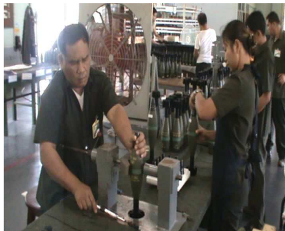
แผนภาพที่ ๔ - ๒ ปบค. ๑๐๕ มม. อัตราร