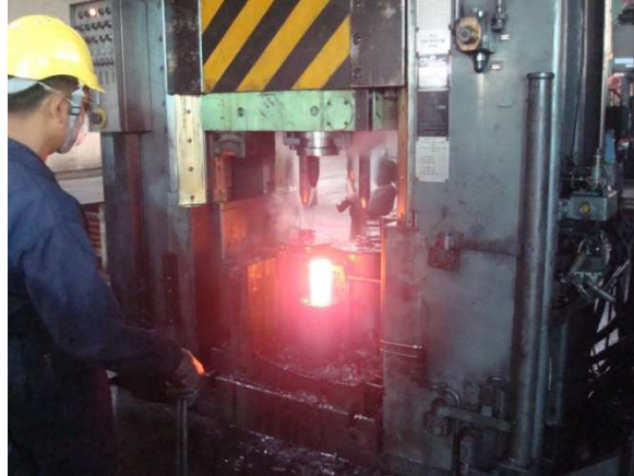
แผนภาพที่ ๔ - ๑ การผลิตกระสุน ป. และ ลย./ค.

กลยุทธ์ที่ ๓.๕ การเตรียมความพร้อมของโรงงานเพื่อการผลิต กลยุทธ์ที่ ๓.๖ การสนองประโยชน์ต่อผู้มีส่วนได้ส่วนเสีย