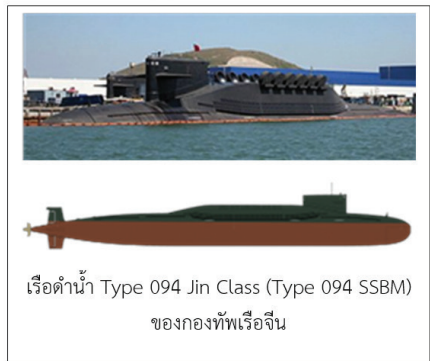
เรือดำน้ำ Type 094 Jin Class (Type 094 SSBM) ของกองทัพเรือจีน

ภาพที่ ๖ รูปเปรียบเทียบเรือดำน้ำประเภท Nuclear-Powered Ballistic Missile Submarines (SSMM) Ohio Class ของสหรัฐอเมริกา กับ Type 094 Jin ของจีน