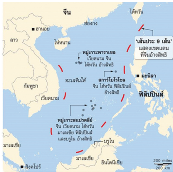
ภาพที่ ๘ อาณาบริเวณทะเลที่จีนอ้างสิทธิในทะเลจีนใต้

ด้านการทหารของจีนได้สร้างความหวาดระแวงว่า จีนจะเป็นภัยคุกคามต่อความมั่นคงในภูมิภาคนี้ โดยเฉพาะกรณีพิพาทเหนือหมู่เกาะในทะเลจีนใต้ที่ยังหาข้อยุติระหว่างประเทศผู้อ้างสิทธิครอบครองเหนือหมู่เกาะไม่ได้ แม้ว่าจะมีความพยายามในการที่จะร่วมมือกันแก้ไขและหาทางออกหลายครั้ง แต่ปัจจุบันความขัดแย้งและข้อพิพาทในทะเลจีนใต้ระหว่างจีนกับประเทศสมาชิกอาเซียน ๕ ประเทศ (มาเลเซีย อินโดนีเซีย ฟิลิปปินส์ เวียดนาม และบรูไนดารุสซาลาม) รวมถึงความขัดแย้งระหว่างจีนกับญี่ปุ่นบริเวณหมู่เกาะเซนกากุ ก็ยังคงมีการกระทบกระทั่งกันเรื่อยมา และมีความตึงเครียดเพิ่มมากขึ้น