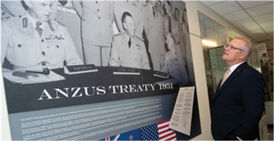
ภาพที่ ๑ “Scott Morrison” นายกรัฐมนตรีคนปัจจุบันของออสเตรเลีย ขณะกำลังเยี่ยมชมโถงนิทรรศการความร่วมมือ ANZUS ในอาคารเพนตากอน ที่ทำการกระทรวงกลาโหมของสหรัฐฯ เมื่อ พ.ศ.๒๕๖๑

ในช่วงสงครามเย็น (Cold War) หลายประเทศมุ่งเน้นไปพัฒนาการก่อรูปทางการทหาร โดยมีต้นแบบที่สำคัญทั้ง ๒ ความร่วมมือ คือ ความร่วมมือองค์การสนธิสัญญา SEATO และสนธิสัญญา ANZUS ซึ่งครอบคลุมอาณาบริเวณที่เรียกว่า “เอเชีย-แปซิฟิก (Asia-Pacific)” และครอบคลุมไปถึงมหาสมุทรอินเดีย ซึ่งต่อมาภายหลังสหรัฐอเมริกาได้เปลี่ยนมาใช้คำว่า “อินโด-แปซิฟิก (Indo-Pacific)” ซึ่งหมายถึง ๒ ภูมิภาคมาประกบกัน คือ ๑) ภูมิภาคมหาสมุทรแปซิฟิก ซึ่งครอบคลุมอาณาบริเวณเอเชียตะวันออกเฉียงใต้ และฝั่งตะวันตกของทวีปอเมริกา โดยมีส่วนตรงกลางเป็นกลุ่มประเทศและดินแดนที่เป็นเกาะในมหาสมุทรแปซิฟิก เช่น เกาะกวม หมู่เกาะมาร์แชลล์ หมู่เกาะโพลินีเซีย และ เมลานีเซีย และ ๒) ภูมิภาครอบมหาสมุทรอินเดีย โดยใช้มหาสมุทรอินเดียเป็นตัวตั้งแล้วรวมประเทศต่าง ๆ ในทวีปเอเชียและออสเตรเลีย ยกเว้นประเทศในทวีปแอฟริกา ดังนั้น ภูมิภาคอินโด-แปซิฟิก จึงครอบคลุมอาณาบริเวณสหรัฐอเมริกา จีน ภูมิภาคเอเชียตะวันออกเฉียงใต้ เอเชียใต้ เอเชียตะวันออกเฉียงใต้ และประเทศหมู่เกาะในมหาสมุทรแปซิฟิก