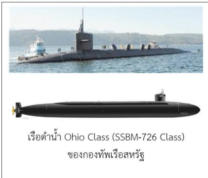
เรือดำน้ำ Ohio Class (SSBM-726 Class) ของกองทัพเรือสหรัฐ

ถูกพัฒนาขึ้นมา และเชื่อว่าจะสามารถนำมาประจำการได้ในปี พ.ศ.๒๕๔๗ โดยวางแผนจะมีการสร้างจำนวน ๑๒ ลำ ในขณะที่กองทัพเรือจีนมีเรือดำน้ำพลังงานนิวเคลียร์ติดตั้งขีปนาวุธนำวิถีที่ประจำการอยู่ เป็นเทคโนโลยีที่เกิดขึ้นในปี พ.ศ.๒๕๕๐ ที่เรียกว่า “Type 094 Jin Class” ซึ่งปัจจุบันจีนมีประจำการจำนวน ๖ ลำ และได้มีการพัฒนาเทคโนโลยีสร้างเรือดำน้ำขึ้นใหม่ในช่วงต้นปี พ.ศ.๒๕๖๓ ที่เรียกว่า “Type 096 Tang Class”