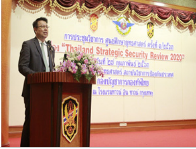
รศ.ดร.กิตติ ประเสริฐสุข รองอธิการบดีฝ่ายวิเทศสัมพันธ์ มหาวิทยาลัยธรรมศาสตร์