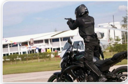
ภาพที่ ๓.๓ อาสาทหารพรานนาวิกโยธินหญิง

จังหวัดชายแดนใต้ เนื่องจากคุณลักษณะพิเศษในการปฏิบัติงานของทหารพรานหญิง ที่มีความอ่อนน้อม นุ่มนวล สามารถพูดคุยกับชาวบ้านได้เหมือนคุยกับคนในครอบครัวตนเอง และทหารพรานหญิงส่วนใหญ่ จะมีภูมิลำเนาอยู่ในพื้นที่ที่สามารถพูดภาษาท้องถิ่นได้คล่อง เพื่อพูดคุยสร้างความเข้าใจและปรับเปลี่ยนทัศนคติของคนในพื้นที่ได้ดียิ่งขึ้น อีกทั้ง