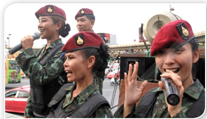
ภาพที่ ๓.๕ ทหารหญิงจากกองร้อย ปฏิบัติการจิตวิทยา

กำลังสำคัญถึงแม้ว่าในบางภารกิจที่ไม่สามารถเข้าปฏิบัติหน้าที่ในตำบลที่ตรากตรำได้ แต่สามารถเป็นหน่วยสนับสนุนในการ ปจว. ได้ อาทิ การป้องกันและปราบปรามการก่อความไม่สงบ การพิทักษ์ประชาชนและทรัพยากร กำหนดการปราบปรามกองกำลังติดอาวุธ การต่อต้านและตอบโต้การก่อการร้าย และการปรับปรุงสภาพแวดล้อมและการช่วยเหลือประชาชน