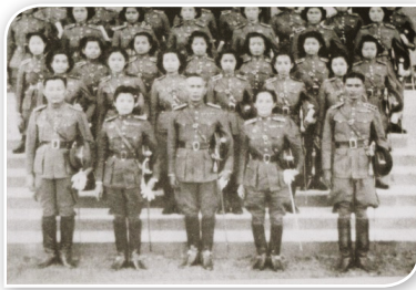
ภาพที่ ๑.๑ นายร้อยทหารหญิงรุ่นแรก ที่สำเร็จการศึกษาในปี ๒๔๘๖

กำหนดไว้ในพระราชบัญญัติการจัดระเบียบราชการกระทรวงกลาโหม พ.ศ.๒๕๕๑ ๑ มาตรา ๖ ประกอบด้วย “ข้าราชการกระทรวงกลาโหมที่เป็นข้าราชการทหาร ทหารกองประจำการ นักเรียนในสังกัดกระทรวงกลาโหมที่ขึ้นทะเบียนกองประจำการ และบุคคลที่ถูกเรียกเข้ารับราชการทหารตามกฎหมายว่าด้วยการนั้น” โดย ข้าราชการกระทรวงกลาโหม แบ่งออกเป็น ๒ ประเภท ได้แก่ ข้าราชการทหารและ ข้าราชการพลเรือนกลาโหม และกระทรวงกลาโหมได้กำหนดภารกิจของทหาร ตามพระราชบัญญัติการจัดระเบียบราชการกระทรวงกลาโหม พ.ศ.๒๕๕๑ มาตรา ๘ ดังนี้ การป้องกันประเทศจากภัยคุกคามทั้งภายในและภายนอกราชอาณาจักร การพิทักษ์รักษา ปกป้องสถาบันพระมหากษัตริย์และสนับสนุนภารกิจของสถาบัน พระมหากษัตริย์ การรักษาผลประโยชน์ของชาติ การพัฒนาประเทศ การป้องกัน และแก้ไขปัญหาจากภัยพิบัติ การช่วยเหลือประชาชน การศึกษา วิจัย พัฒนา และ ดำเนินการด้านอุตสาหกรรมป้องกันประเทศและพลังงานทหาร วิทยาศาสตร์และ เทคโนโลยีป้องกันประเทศ และกิจการอวกาศเทคโนโลยีสารสนเทศและการสื่อสาร เพื่อความมั่นคงของประเทศ และการปฏิบัติการทางทหารนอกเหนือจากสงคราม