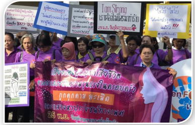
ภาพที่ ๒.๔ กิจกรรมเรียกร้องสิทธิสตรีไทย

๒.๑.๖ การเคลื่อนไหวทางสังคมในโลกปัจจุบัน หากไม่นับรวมการเคลื่อนไหวทางการเมืองแล้ว ในโลกปัจจุบันได้ปรากฏภาพของกลุ่มคนทั่วโลกออกมามีส่วนร่วมในขบวนการเคลื่อนไหวทางสังคมเพิ่มมากขึ้น อาทิ การเคลื่อนไหวด้านสิทธิมนุษยชน (Human right Movement) ที่เรียกร้องถึงสิทธิมนุษยชนในด้านต่าง ๆ ทั้งสิทธิคนพิการ สิทธิเด็ก สิทธิสตรี และสิทธิของผู้สูงอายุ การเคลื่อนไหวเพื่อสันติภาพ (Peace movements) เพื่อการรณรงค์ให้มีการยุติความขัดแย้ง สงคราม และการไม่ใช้ความรุนแรงในทุกรูปแบบ โดยเฉพาะในเด็กและสตรี และกระบวนการสร้างสันติภาพในพื้นที่ขัดแย้ง ตลอดจนการคัดค้านการใช้อำนาจ และการทำสงครามด้วย การเคลื่อนไหวของสตรี (Women’s movements) ที่ให้ความสำคัญการปกป้องสิทธิ สถานภาพ ความเป็นมนุษย์ของสตรี และความเท่าเทียมทางเพศ เพื่อขจัดความเหลื่อมล้ำและการกดขี่ทางเพศ รวมถึงการเรียกร้องการมีส่วนร่วมทางการเมือง เศรษฐกิจ สังคม การศึกษา วัฒนธรรม และความมั่นคงปลอดภัยในการดำเนินชีวิต