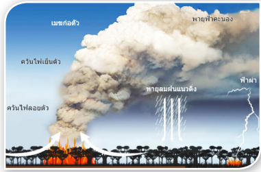
ภาพที่ ๒.๒ แสดงไฟป่าที่สามารถสร้างสภาพภูมิอากาศได้ด้วยตัวเอง

ประสบปัญหาภัยแล้งที่รุนแรง ประชาชนนับล้านคนขาดแคลนน้ำสำหรับอุปโภคและบริโภค นำไปสู่การต่อสู้เพื่อแย่งชิงน้ำจนกลายเป็นเหตุจลาจลที่ทำให้มีผู้เสียชีวิตจากการถูกทุบตี น้ำท่วมใหญ่ในกรุงจาการ์ตา ประเทศอินโดนีเซีย ภายหลังจากเกิดฝนตกหนักในช่วงวันหยุดต่อเนื่องเทศกาลคริสต์มาสและปีใหม่ เหตุการณ์น้ำท่วมครั้งนี้ได้สร้างความเสียหายในภาคธุรกิจสูงถึง ๗๑.๙๑ ล้านดอลลาร์สหรัฐ และ เหตุการณ์ไฟไหม้ป่าในออสเตรเลีย ที่เผาทำลายพื้นที่กว่า ๑๑ ล้านเฮกตาร์ มีผู้เสียชีวิตกว่า ๓๐ คน และสัตว์ป่ากว่า ๕๐๐ ล้านตัว นับเป็นสถานการณ์ไฟป่าที่รุนแรงที่สุดในรอบหลายสิบปีของออสเตรเลีย เป็นต้น