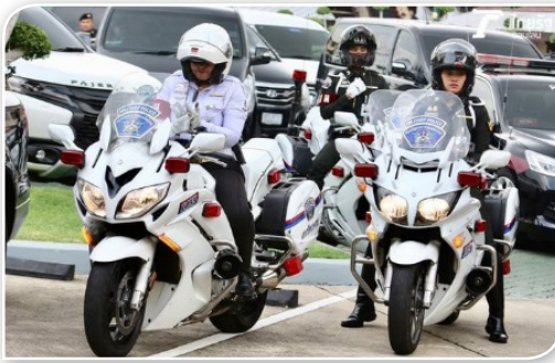
ภาพที่ ๓.๖ สารวัตรทหารหญิงกองบัญชาการกองทัพ ไทยปฏิบัติหน้าที่ ขับรถจักรยานยนต์นำขบวน (ภาพจาก : ไทยรัฐออนไลน์, ๒๕๖๑ )

๓.๒.๑.๔ สารวัตรทหารหญิง (สท.หญิง) ปัจจุบันสารวัตรทหารหญิง ได้แสดงขีดความสามารถให้ปรากฏแก่สาธารณชนมากยิ่งขึ้น โดยมีบทบาทหน้าที่ในการรักษาวินัย กฎหมาย และคำสั่ง รวมถึงมีหน้าที่สอดส่องตรวจตรา ข้าราชการทหารหรือลูกจ้างในสังกัดให้อยู่ในระเบียบวินัย มีความสงบเรียบร้อย และ