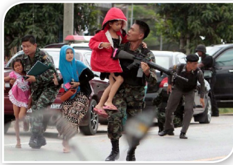
ภาพที่ ๒.๗ ภาพเหตุการณ์ความ ไม่สงบในพื้นที่จังหวัดชายแดนใต้ (ภาพจากอินเตอร์เน็ต)

๒.๓.๑ ความไม่สงบในจังหวัดชายแดนใต้ ยังคงเป็นปัญหาสำคัญของ ประเทศ ที่มีผลมาจากความแตกต่างของประชาชนในพื้นที่ทั้งเชื้อชาติ ศาสนา อัตลักษณ์ทางวัฒนธรรม ทศนคติ ความเชื่อและพฤติกรรมของประชาชนในพื้นที่ รวมถึงอุดมการณ์ของกลุ่มคนบางกลุ่มที่มีความต้องการแบ่งแยกดินแดน ที่นำไปสู่