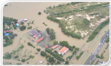
ภาพที่ ๒.๓ น้ำท่วม จ.อุบลราชธานี ในปี พ.ศ.๒๕๖๒ (โพสต์ทูเดย์ออนไลน์, ๒๕๖๒)

สำหรับสถานการณ์ภัยพิบัติทางธรรมชาติในไทย ถึงแม้ว่าไทยตั้งอยู่ในภูมิภาคที่มีความเหมาะสม ทำให้ไทยไม่ต้องเผชิญกับภัยพิบัติทางธรรมชาติที่รุนแรงและบ่อยครั้งเหมือนประเทศอื่นในภูมิภาคเดียวกัน แต่ภัยธรรมชาติที่เกิดขึ้นในประเทศไทยที่สร้างความเสียหายมาก ได้แก่ พายุหมุนเขตร้อน แผ่นดินไหว อุทกภัย พายุฝนฟ้าคะนองหรือพายุฤดูร้อน แผ่นดินถล่ม คลื่นพายุซัดฝั่ง ไฟป่า และฝนแล้ง เป็นต้น