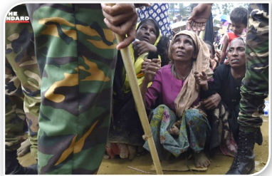
ภาพที่ ๒.๕ ชาวโรฮีนจา ในสหภาพเมียนมา

๒.๒.๒ ผู้อพยพชาวโรฮีนจา สถานการณ์เกี่ยวกับผู้อพยพชาวโรฮีนจาที่ยังไม่ได้ข้อยุติและเป็นประเด็นสำคัญของภูมิภาคอาเซียน ที่มีแรงกดดันจากองค์กรระหว่างประเทศในลักษณะต่าง ๆ ที่ออกมาเรียกร้องให้ทำการสอบสวนเมียนมากรณีล้างเผ่าพันธุ์และเรียกร้องให้เมียนมาและบังกลาเทศระงับการส่งกลับผู้อพยพชาวโรฮีนจา เนื่องจากสถานการณ์ภายในรัฐยะไข่ยังไม่มีความปลอดภัยและกระบวนการส่งกลับยังขาดความโปร่งใส และเมื่อปลายปี ๒๕๖๒ เกมเบีย ยีนฟ้องร้องรัฐบาลเมียนมากับศาลยุติธรรมระหว่างประเทศ (International Court of Justice : ICJ) ในข้อหาละเมิดอนุสัญญาว่าด้วยการป้องกันและลงโทษความผิดอาญารัฐบาลล้างเผ่าพันธุ์ รวมถึงระหว่างการประชุมสุดยอดผู้นำอาเซียน (ASEAN Summit) ครั้งที่ ๓๕ ที่ไทยเป็นเจ้าภาพ เลขาธิการสหประชาชาติ (UN) ได้เรียกร้องให้รัฐบาลเมียนมารับประกันความปลอดภัยของชาวโรฮีนจาในการเดินทางกลับเมียนมา พร้อมทั้งเรียกร้องให้รัฐบาลเมียนมาเปิดโอกาสให้องค์กรด้านมนุษยธรรมจากนานาชาติเข้าถึงพื้นที่ที่ได้รับผลกระทบโดยไม่ถูกจำกัดสิทธิ