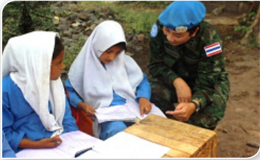
ภาพที่ ๓.๙ ทหารหญิงกองทัพไทย กับภารกิจรักษาสันติภาพ (ภาพจาก : กองบัญชาการกองทัพไทย, ๒๕๖๒)

๓.๒.๓ การปฏิบัติการเพื่อสันติภาพ กองทัพไทยได้ดำเนินการจัดส่งทหารหญิงเข้าร่วมปฏิบัติการรักษาสันติภาพ ตามกรอบของสหประชาชาติ ตั้งแต่ปี พ.ศ.๒๕๔๕ จนถึงปัจจุบันจำนวนรวม ๑๑๓ นาย โดยทำหน้าที่เป็นผู้สังเกตการณ์ทางทหารและนายทหารฝ่ายอำนวยการ ในภารกิจต่าง ๆ อาทิ ๑) ภารกิจ UNAMID