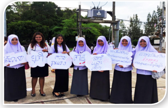
ภาพที่ ๒.๘ การเดินรณรงค์ยุติความรุนแรงในพื้นที่ชายแดนใต้ (สำนักข่าวอิศรา, ๒๕๕๘)

เป็นหม้าย และมีเด็กกำพร้าที่ต้องสูญเสียพ่อแม่จำนวนมาก แม้ว่าเหตุการณ์ความไม่สงบในปัจจุบันมีจำนวนลดลง และมีจุดประสงค์มุ่งจะทำร้ายเจ้าหน้าที่ของรัฐก็ตาม แต่ปัญหาอาชญากรรมที่แพร่ระบาดในกลุ่มเยาวชนในพื้นที่กลับมีเพิ่มมากขึ้น ซึ่งปัญหาดังกล่าวอาจทำให้เยาวชนถูกชักจูงให้เข้าไปมีส่วนร่วมในการเคลื่อนไหวของกลุ่มผู้ก่อความไม่สงบในพื้นที่ได้ง่ายและเพิ่มความซับซ้อนของปัญหามากยิ่งขึ้น