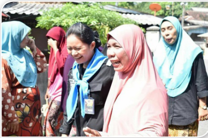
ภาพที่ ๓.๔ อาสาทหารพรานหญิง ขณะปฏิบัติหน้าที่ในพื้นที่จังหวัดชายแดนใต้ (ภาพจาก : ผู้จัดการออนไลน์, ๒๕๖๓)

ทหารพรานหญิงในพื้นที่จังหวัดชายแดนใต้ จะได้รับการฝึกหลักสูตรพิเศษ เช่น การทำคลอด การปฐมพยาบาลเบื้องต้น และการช่วยเหลือผู้ป่วยในพื้นที่ห่างไกล จึงทำให้ทหารพรานหญิง สามารถเข้าช่วยเหลือประชาชนที่ได้รับผลกระทบจากความขัดแย้งในพื้นที่ และได้รับความร่วมมือเมื่อมีการประสานเรื่องต่าง ๆ ระหว่างเจ้าหน้าที่รัฐและประชาชนได้เป็นอย่างดี