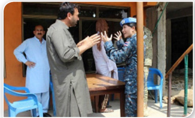
ภาพที่ ๓.๑๐ ทหารหญิงกองทัพไทย กับภารกิจรักษาสันติภาพ

การในภารกิจเพื่อสันติภาพในแต่ละพื้นที่ เป็นที่ยอมรับและได้รับค่าชื่นชมทั้งในระดับภูมิภาคและนานาชาติ เนื่องจากทหารหญิงไทยสามารถเข้าร่วมปฏิบัติการในบทบาทหน้าที่และภารกิจที่หลากหลายโดยเฉพาะหน้าที่ในการรวบรวมข้อมูลของผู้เสียหาย จากการถูกทารุณ การใช้ความรุนแรง และการถูกคุกคามทางเพศ ของเด็กและสตรีที่อยู่ในพื้นที่ปฏิบัติงาน เนื่องจากลักษณะ เฉพาะของหญิงไทยที่มีความอ่อนน้อม นุ่มนวล และเป็นมิตร จึงช่วยลดแรงกดดันจากสถานการณ์ต่าง ๆ ทำให้เข้าถึงจิตใจประชาชนในพื้นที่และประชาชนยินยอมให้ข้อมูลส่วนบุคคลกับเจ้าหน้าที่อย่างเปิดเผย