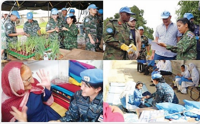
ภาพที่ ๓.๑๑ กำลังพลทหารหญิงของกองทัพไทยขณะปฏิบัติหน้าที่ ในการกิจรักษาสันติภาพ