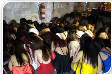
ภาพที่ ๒.๙ การจับกุมสถานบันเทิงลักลอบค้าประเวณี

ผู้เสพ แต่ยังมีผลกระทบต่อความมั่นคงของชาติในอีกหลายด้าน ได้แก่ ด้านเศรษฐกิจ ด้านสังคม การบริหารจัดการภาครัฐ และความสัมพันธ์ระหว่างประเทศ ตลอดจนปัญหา ยาเสพติดยังมีความเชื่อมโยงการก่อการร้ายและอาชญากรรมข้ามชาติ อาทิ การค้ามนุษย์ การฟอกเงิน การลักลอบค้าอาวุธ เนื่องจากไทยมีการเปิดเสรีด้านการท่องเที่ยว และเป็นศูนย์กลางคมนาคมที่นักท่องเที่ยวสามารถเดินทางเข้าออกประเทศโดยง่าย ทำให้อาชญากรรมแฝงตัวมาในรูปแบบของนักท่องเที่ยว และเข้ามามีผลกระทบต่อความมั่นคงในไทย