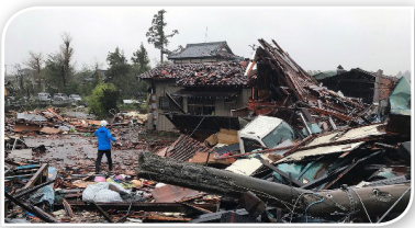
ภาพที่ ๒.๑ ความเสียหายจากซูเปอร์ไต้ฝุ่นฮากีบิส (ไทยรัฐออนไลน์, ๒๕๖๒)

๒.๑.๕ ภัยพิบัติทางธรรมชาติ การเปลี่ยนแปลงสภาพภูมิอากาศทำให้หลายประเทศต้องเผชิญกับปัญหาภัยธรรมชาติที่เกิดจากสภาพภูมิอากาศ