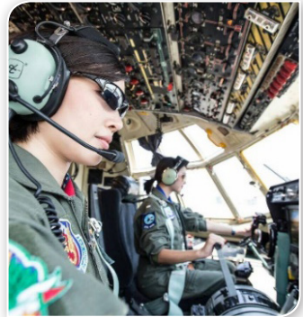
ภาพที่ ๓.๒ นักบินหญิงของกองทัพอากาศไทย

๓.๒.๑.๑ นักบินหญิง ปัจจุบันกองทัพอากาศมีนักบินหญิงที่บรรจุอยู่ในกองทัพอากาศจำนวน ๗ นาย ปฏิบัติหน้าที่นักบินประจำเครื่องบิน ซี ๑๓๐ ที่ฝูงบิน ๖๐๑ จำนวน ๕ นาย และกำลังเข้ารับการฝึกบินที่ฝูงบิน ๖๐๔ อีก ๒ นาย ซึ่งการเปิดอัตราบรรจุนักบินหญิงของกองทัพอากาศครั้งนี้เป็นการทบทวนการใช้ทหารหญิงในส่วนงานด้านกำลังรบเพื่อนำไปสู่การดำเนินการขอแก้ไขกฎระเบียบกท.ว่าด้วยทหารหญิง ต่อไป