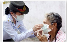
ภาพที่ ๓.๘ แพทย์และพยาบาลทหารหญิงปฏิบัติหน้าที่ช่วยเหลือประชาชน