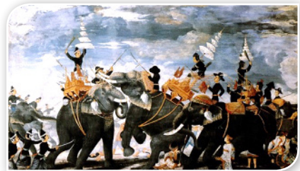
ภาพที่ ๓.๑ ภาพเขียนพระสุริโยทัยชนช้างกับพระเจ้าแปร และสิ้นพระชนม์บนคอช้าง (ภาพจากโคลงภาพพระราชพงศาวดาร ฝัพระหัตถ์สมเด็จพระเจ้าฟ้ากรมพระยานริศรานุวัดติวงศ์

หากย้อนประวัติศาสตร์ถึงพัฒนาการของทหารหญิงไทยในอดีต ผู้หญิงมีความสามารถให้การทำการรบอยู่ในแนวหน้าของสงครามในการปกป้องบ้านเมืองของตนเอง อาทิ สมเด็จพระสุริโยทัยที่ทรงทำการรบกับพระเจ้าแปรแม่ทัพของกองทัพพม่า ท้าวเทพกษัตรีและท้าวศรีสุนทรเมื่อครั้งพม่ายกกองทัพเรือเข้าตีเมืองท่าฝั่งทะเลอันดามันในปี พ.ศ.๒๓๒๘ ท้าวสุนารี่เมื่อครั้งเจ้าอนุวงศ์แห่งเมืองเวียงจันทร์ยกกองทัพมากวาดต้อนพลเมืองนครราชสีมา เพื่อเดินทางไปเวียงจันทร์ เป็นต้น จนถึงในยุคปัจจุบันทหารหญิงของไทยมีบทบาททางทหารในแบบที่ไม่ได้ทำการรบ (Non-combat roles) ตามข้อบังคับ กท. ว่าด้วยทหารหญิง พ.ศ.๒๕๒๗ ซึ่งมีความสอดคล้องกับบทบาททหารหญิงในบริบทโลก ที่แต่ละประเทศมีการกำหนดคุณลักษณะของทหารหญิงไว้ได้คล้ายคลึงกัน คือการยึดจากลักษณะ