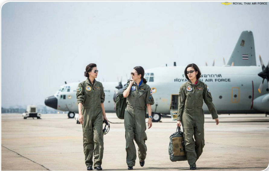
ภาพที่ ๒.๑๑ นักบินหญิงกองทัพอากาศไทย

ดังนั้น สัดส่วนและจำนวนการบรรจุทหารหญิงของกองทัพไทยในภาพรวมทั้งหมด ไทยมีข้าราชการทหารทั้งสิ้นประมาณ ๒๕๒,๘๔๕ นาย เป็นข้าราชการทหารหญิงทั้งสิ้นประมาณ ๒๒,๑๐๓ นาย คิดเป็นสัดส่วนร้อยละ ๘.๗ ของอัตรากำลังพลทั้งหมด จะเห็นได้ว่าสัดส่วนของทหารหญิงในกองทัพยังคงน้อยกว่าเกณฑ์ตามข้อบังคับของ กท.ว่าด้วยทหารหญิง พ.ศ.๒๕๒๗ และมติการประชุมสภากลาโหม ครั้งที่ ๖/๓๙ เมื่อ ๒๐ มิ.ย.๓๙ กำหนดอยู่มาก โดยเฉพาะ ทร. และ ทบ. ที่มีทหารหญิงบรรจุอยู่ในเหล่าทัพในสัดส่วนร้อยละ ๓.๘ และ ๖ ตามลำดับ