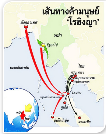
ภาพที่ ๒.๖ เส้นทางอพยพของ ชาวโรฮีนจา (สำนักข่าวอิสรာ, ๒๕๕๙)

นอกจากปัญหาการอพยพชาวโรฮีนจาเป็นประเด็นที่นานาชาติให้ความสนใจเกี่ยวกับการแก้ไข ปัญหาของรัฐบาลเมียนมา ไทยก็ได้รับผลกระทบ จากสถานการณ์ดังกล่าวด้วยเช่นกัน เนื่องจากไทย อยู่ในสถานะประเทศเพื่อนบ้านและเป็นประเทศ ทางผ่านในเส้นทางการอพยพสู่ประเทศที่สามของ ชาวโรฮีนจา ที่ต้องเฝ้าระวังและป้องกันปัญหาที่อาจ เกิดขึ้น เช่น การลักลอบเดินทางเข้าเมืองแบบผิด กฎหมาย อาชญากรรมข้ามชาติ และการค้ามนุษย์ เป็นต้น