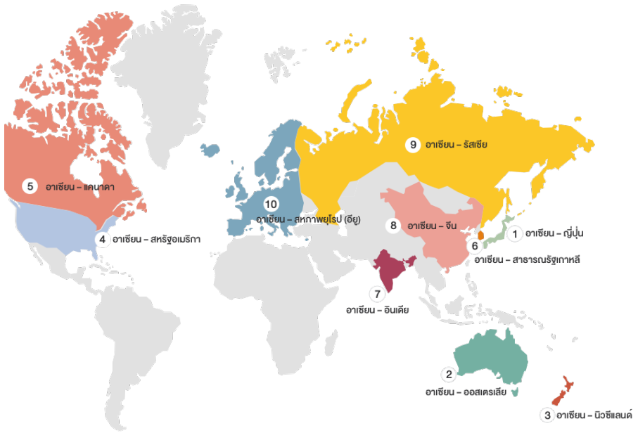
ภาพที่ 2 แสดงแผนที่ของอาเซียนและประเทศคู่เจรจา

นอกจากนี้ตามกฎบัตรอาเซียนข้อ 44 อาเซียนยังมีปฏิสัมพันธ์กับภาคีภายนอกในสถานะอื่นๆ เช่น การเป็นผู้เจรจาเฉพาะสาขา ได้แก่ ปากีสถาน นอร์เวย์ สวิตเซอร์แลนด์ และตุรกี และการเป็นหุ้นส่วนเพื่อการพัฒนา คือ เยอรมนี และยังมี ปาปัวนิวกินี เป็นประเทศผู้สังเกตการณ์พิเศษของอาเซียนอีกด้วย ซึ่งความสัมพันธ์และความร่วมมือกับภาคีภายนอกเหล่านี้ นอกจากจะช่วยเสริมสร้างสันติภาพและส่งเสริมการพัฒนาทางเศรษฐกิจในภูมิภาคแล้ว ยังมีส่วนช่วยแก้ไขปัญหาท้าทายร่วมกัน ทั้งปัญหาที่เกิดจากการเปลี่ยนแปลงสภาพภูมิอากาศ ภัยพิบัติทางธรรมชาติ การก่อการร้ายและอาชญากรรมข้ามชาติ รวมทั้งช่วยเสริมสร้างคุณภาพชีวิตที่ดีของประชาชน ผ่านความร่วมมือด้านการศึกษา สาธารณสุข และการพัฒนาที่ยั่งยืน