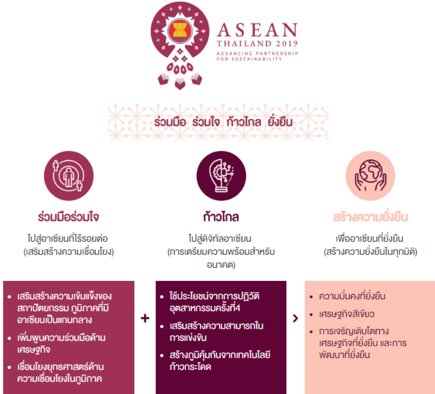
ภาพที่ 3 แสดงแนวคิดหลักในการเป็นประธานอาเซียนของไทย พ.ศ. 2562