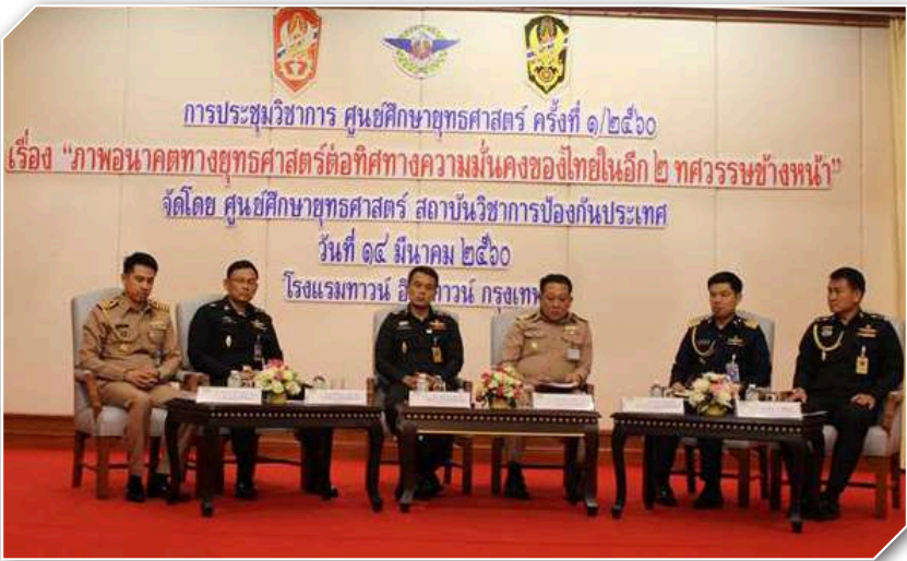
ภาคผนวก ก การประชุมวิชาการ ศูนย์ศึกษายุทธศาสตร์ ครั้งที่ ๑/๒๕๖๐ วันที่ ๑๔ - ๑๕ มี.ค.๖๐ เรื่อง “ภาพอนาคตทางยุทธศาสตร์ต่อทิศทางความมั่นคงของไทยในอีก ๒ ทศวรรษข้างหน้า” ณ โรงแรมทาวน์ อิน ทาวน์ กรุงเทพฯ