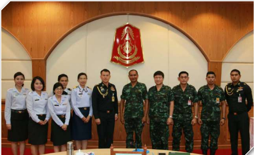
ภาคผนวก ค การเดินทางลงพื้นที่เก็บรวบรวมข้อมูล ในวันที่ ๖ มิ.ย.๖๐ โดยคณะวิจัย ศศย.สพท. เข้าประชุมรับฟังและแลกเปลี่ยนข้อมูล ณ ทภ.๔ จ.นครศรีธรรมราช