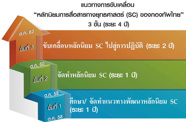
ภาพที่ 1 แนวทางการขับเคลื่อนหลักนิยมการสื่อสารทางยุทธศาสตร์ (SC) ของกองทัพไทย

สรุปได้ว่า จากความสำคัญของปัญหา SC และ IO ในบริบทโลกยุคปัจจุบัน และองค์ความรู้ที่มีอยู่ของกองทัพไทย ทำให้ ศสย.สปท. เห็นควรเป็นอย่างยิ่ง ในการดำเนินการศึกษาวิจัย เรื่อง “แนวทางการพัฒนาหลักนิยมการสื่อสารทางยุทธศาสตร์ (SC) ของกองทัพไทย” เพื่อกำหนดแนวทางการพัฒนาหลักนิยม SC ของกองทัพไทย อันถือเป็นจุดเริ่มต้นในการยกระดับขีดความสามารถด้านการสื่อสารทางยุทธศาสตร์ของกองทัพไทยในอนาคต...๐