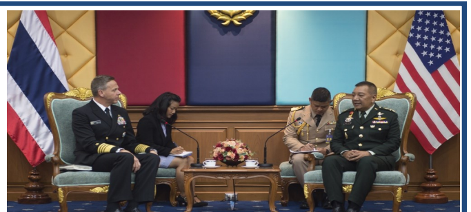
พล.ร.อ. ฟิลลิป เอส เดวิดสัน ผบ.USINDOPACOM เข้าเยี่ยมคำนับ พล.อ. พรพิพัฒน์ เบญญศรี ผบ.ทสส. ระหว่างการเยือนไทย เมื่อ ๑๗ ต.ค.๖๑