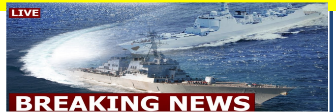
เรือพิฆาตดิมิสไฮล์นำวิถี ยูเอสเอสดีเคเตอร์ ของสหรัฐฯ ถูกเรือพิฆาตคู่หูของจีน แล่นประกบในทะเลจีนใต้ เมื่อ ต.ค.๖๑