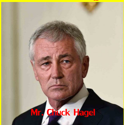
Mr. Chuck Hagel