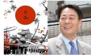
พรรคประชาธิปไตยญี่ปุ่น (DPJ) (ฝ่ายค้าน)