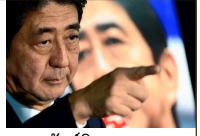
พรรคอนุรักษ์นิยม LDP (ฝ่ายรัฐบาล)

แนวคิด: ผลักดันการปรับแก้รัฐธรรมนูญภายในปี ๒๐๒๐ เพื่อเพิ่มบทบาทด้านความมั่นคง