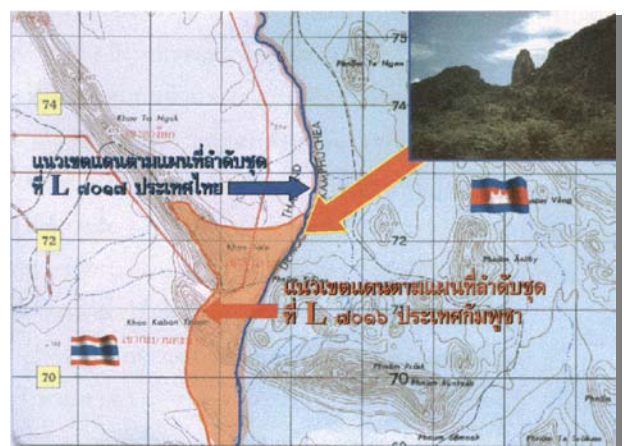
พื้นที่เขาตาร็อก อ.คลองหาด จ.สระแก้ว

๑.๓ พื้นที่เขาตาร็อก อ.คลองหาด จ.สระแก้ว จากการที่ไทยและกัมพูชาต่างยึดแผนที่คนละลำดับชุด ทำให้เกิดการทับกันของแนวเขตแดน เมื่อตรวจสอบจากบันทึกการประชุมระหว่างคณะกรรมการฝรั่งเศส-สยามเพื่อการปักปันเขตแดนระหว่างอินโดจีนกับไทย ค.ศ.๑๙๐๘ (พ.ศ.๒๔๕๑) แล้วแนวเขตแดนดังกล่าวลากไปตามลำน้ำคลองด่านจนถึงยอดเขาดินเขาตาร็อก ซึ่งบริเวณเชิงเขาเป็นต้นกำเนิดลำน้ำ แต่ปัจจุบันจุดต้นกำเนิดลำน้ำนั้นได้เกิดการเปลี่ยนแปลงตามสภาพธรรมชาติและยังไม่สามารถตรวจสอบหาจุดที่แน่นอนได้จนกว่าจะมีการปักปันเขตแดนใหม่