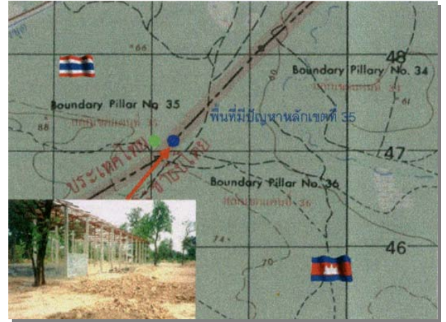
พื้นที่ช่องตาพระยา/บึงตระกวน (หลักเขตแดนที่ ๓๕)

๑.๒ พื้นที่ช่องตาพระยา/บึงตระกวน (หลักเขตแดนที่ ๓๕) ซึ่งกัมพูชาอ้างว่าเคยอยู่ในบริเวณบังเกอร์เก่าของกัมพูชาแต่ไม่มีหลักฐานเนื่องจากหลักเขตดังกล่าวได้สูญหายไป ต่อมาเมื่อ ๒๔ ธ.ค.๔๑ ไทยและกัมพูชาทำพิธีเปิดจุดผ่อนปรนตาพระยา-บึงตระกวน เพื่อให้ประชาชนทั้งสองประเทศค้าขายกัน และสร้างอาคารที่ทำการสำหรับเจ้าหน้าที่ตรวจคนเข้าเมือง แต่กัมพูชาประท้วงโดยอ้างว่าเมื่อเล็งจากหลักเขตแดนที่ ๓๔ ไปยังหลักเขตแดนที่ ๓๕ และ