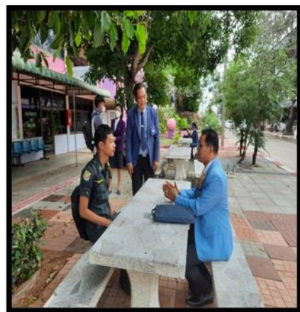
ภาพถ่ายการลงพื้นที่ โรงเรียนคอนสวรรค์ สำนักงานเขตพื้นที่การศึกษามัธยมศึกษาชัยภูมิ