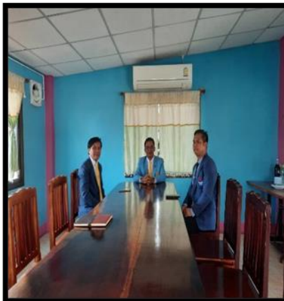
ภาพถ่ายการลงพื้นที่ โรงเรียนคอนสวรรค์ สำนักงานเขตพื้นที่การศึกษามัธยมศึกษาชัยภูมิ