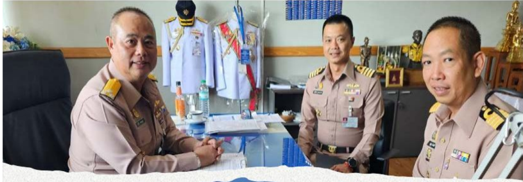
พล.ร.ท.สุวัจ ดอนสกุล จก.ยก.ทร.