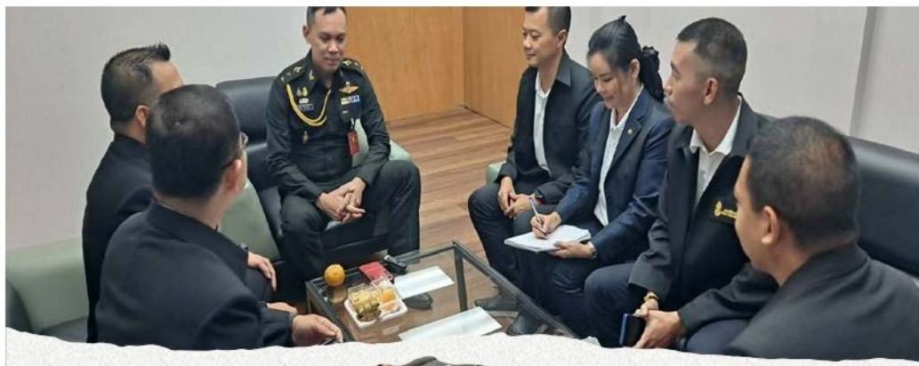
พ.อ.วิทยา อินนาคกุล ผสธ.ประจำ ยก.ทบ.